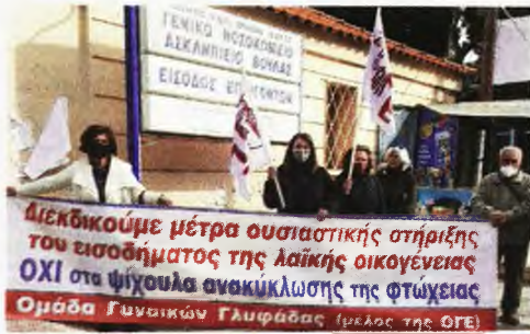
Εξορμηση στο Ασκληλείο Βουλας ενοφει του συλλαλητηριου

των λίγων», ξεκαθαρίζουν τα σωματεία που καλούν στα συλλαλητήρια και διεδικούν: