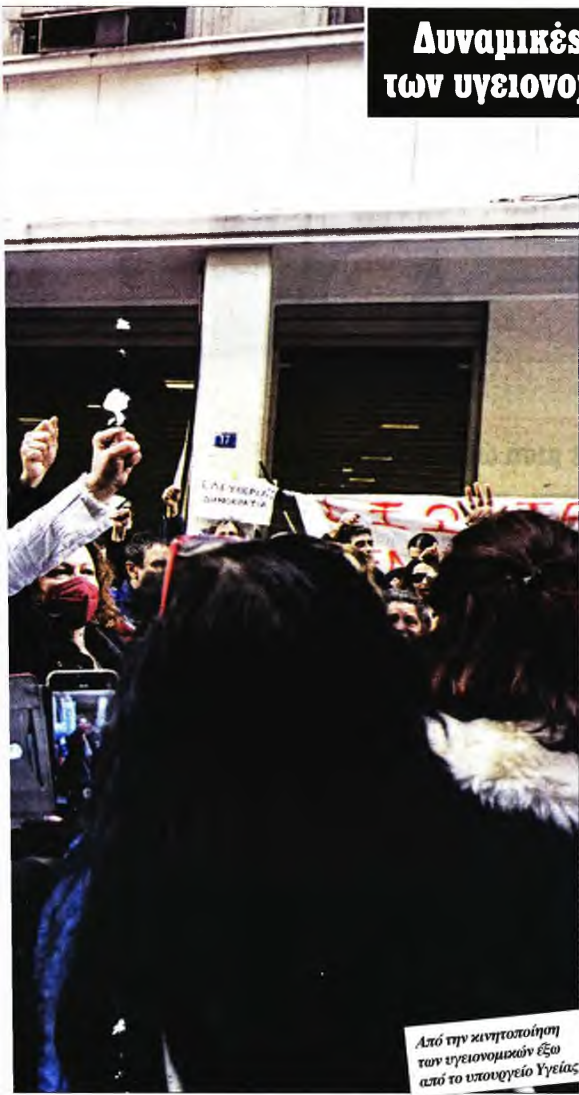
Από την κινητοποίηση των υγειονομικών έξω από το υπουργείο Υγείας

ΜΕΓΑΛΕΣ πορείες στο κέντρο της Αθήνας και της Θεσσαλονίκης πραγματοποιήσαν χθες οι υγειονομικοί των δημόσιων νοσοκομείων της χώρας, στον απόηχο των δηλώσεων Πλεύρη που προανήγγειλε την άλωση του Εθνικού Συστήματος Υγείας από τους ιδιώτες, αλλά και της δραματικής κατάστασης στην οποία βρίσκονται τα δημόσια νοσοκομεία εν μέσω πανδημίας. Στη χθεσινή συγκέντρωση, που συνεχίστηκε με πορεία προς τη Βουλή και μετά στο υπουργείο Υγείας, συμμετείχαν μέλη της Ομοσπονδίας Ενώσεων Νοσοκομειακών Γιατρών Ελλάδας (ΟΕΝΓΕ) και της Πανελληνίας Ομοσπονδίας Εργαζομένων Δημόσιων Νοσοκομείων (ΠΟΕΔΗΝ). «Το προσωπικό των νοσοκομείων έμεινε αβοήθητο να προσπαθεί να αποκρούσει το ένα μετά το άλλο πανδημικό κύμα, με τραγικές ελλείψεις σε προσωπικό, υποδομές και εξοπλισμό» ανέφερε σε ανακοίνωσή της η ΟΕΝΓΕ, ενώ η ΠΟΕΔΗΝ έκανε λόγο για δυσμενή επιδημιολογικά δεδομένα που αναδεικνύουν τις παθογένειες του Εθνικού Συστήματος Υγείας σε πρωτοβάθμια και νοσοκομειακή περίθαλψη.