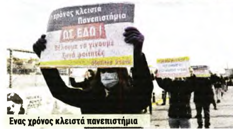
Ενα χρόνος κλειστά πανεπιστήμια