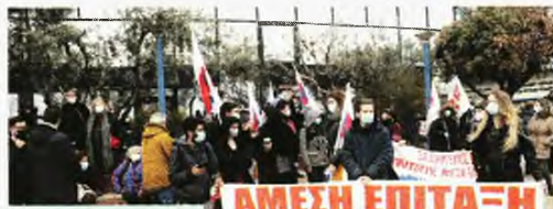
23/3/2021: Κινητοποιήσεις σε ιδιωτικές δομές για άμεση επίταξη του ιδιωτικού τομέα

Με φιάστες υποδέχεται η κυβέρνηση την άφιξη της πρώτης παρτίδας εμβολίων, ξεκινώντας την προπαγάνδα ότι «τελειώνουμε με την πανδημία» και αξιοποιώντας το εμβόλιο ως «άλλοθι» για να μην πάρει μέτρα αλλά και ως «μόχλο» για αντεργατικές ανατροπές.