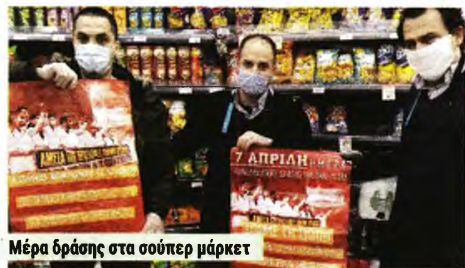
Μέρα δράσης στα σουπερ μάρκετ

23 Μάρτη: Η κλιμάκωση των περιοριστικών μέτρον, για να μην πιεστεί το ξεχαρβαλωμένο σύστημα Υγείας, φτάνει μέχρι και την πρώτη γενική απαγόρευση της κυκλοφορίας. Είναι η περίοδος που οι αρμόδιοι υπουργοί επικαλούνται - εκτός από τις συστάσεις των «ειδικών» - την «κοινωνική ανευθύνητητα». Από την άλλη, η κυβέρνηση, αρνούμενη να κάνει προλήψεις, περιορίζει σε 7 από 14 τις μέρες καραντίνης για υγειονομικούς που ήρθαν σε επαφή με κρούσμα, κάνει