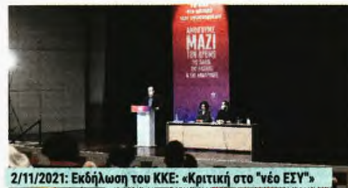
2/11/2021: Εκδήλωση του ΚΚΕ: «Κριτική στο «νέο ΕΣΥ»

Ιούνη: Με τα υλικά που τσακίζουν τις λαϊκές ανάγκες στην Υ-