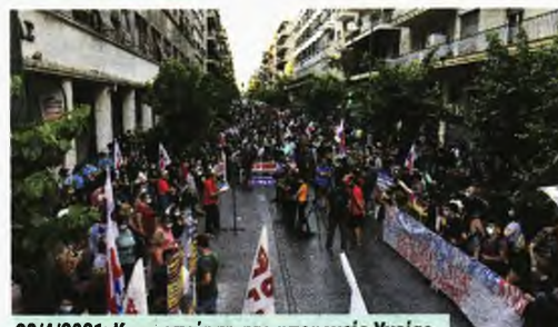
20/4/2021: Κινητοποίηση στο υπουργείο Υγείας

20 Ιούλη: Με νέες κινητοποιήσεις υγειονομικοί και σωματεία ζητάνε άμεσα μέτρα. Εντέλει τον Αύγουστο, με ταχύτατους ρυθμούς αναζωπυρώνεται για τέταρτη φορά η πανδημία, με πολλές περιοχές να είναι στο «κόκκινο» και την κυβέρνηση να κλιμακώνει τις υποδείξεις περί «ατομικής ευθύνης» ως το φάρμακο «διά πάσαν νόσον».