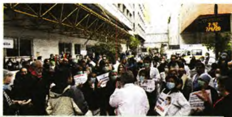
Πανελλαδική μέρα δράσης για την Υγεία - «Ευαγγελισμός»

Μ ια συνοπτική αναδρομή στα δύο χρόνια της πανδημίας φανερώνει τον «Γολγοθά» που συνεχίζει να ανεβαίνει ο λαός, σε μια διαρκή αναμέτρηση με το σμαραλαίο-σμένο σύστημα Υγείας και τη στρατηγική που βλέπει τις ανάγκες του ως εμπόρευμα. Κάθε μήνας, κάθε νέα απόφαση, κάθε «σταθμός» σε αυτήν την εξέλιξη αποκαλύπτει τις εγκληματικές συνέπειες από την πολιτική εμπορευματοποίησης της Υγείας όλων των κυβερνήσεων, της ΕΕ, τη στρατηγική θωράκισης των επιχειρηματικών ομίλων. Όμως, αυτά τα δύο χρόνια έδειξαν και τη δύναμη του οργανωμένου λαού, όταν παλεύει και διεκδικεί κόττρα σε αυτήν την εγκληματική πολιτική. Αποδείχθηκε ότι τελικά «Μόνο ο λαός μπορεί να σώσει τον λαό, βαδίζοντας στον δρόμο της ανατροπής».