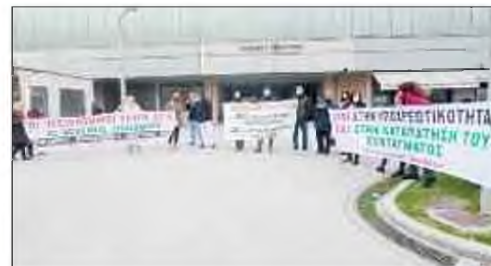
Χθες το πρωί συγκεντρώθηκαν στο προαύλιο του ιδρύματος και πραγματοποίησαν συγκέντρωση διαμαρτυρίας