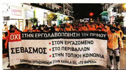
Το «σχέδιο εξμίσθωσης του Πρίνου», που περιλαμβάνει απολύσεις και αντικατάσταση του έμπειρου εξειδικευμένου προσωπικού με φθηνότερους εργολαβικούς εργαζόμενους και η εργοδοσία της «Energean» το βάζει μπροστά προκειμένου να ξεκινήσει

Μ αζικό και μαχητικό «παρόν» στο συλλαλητήριο στο Σύνταγμα δίνουν οι εργαζόμενοι από τα «Πετρέλαια Καβάλας» και τη ΒΦΛ , έχοντας στο πλευρό τους τις οικογένειές τους αλλά και σωματεια και μαζικούς φορείς της πόλης, που συμπαραστέκονται στον πολυήμερο αγώνα τους ενάντια στις απολύσεις. Το Σωματεια Εργαζομένων στα «Πετρέλαια Καβάλας», του οποίου το ΔΣ απολύθηκε ολόκληρο από την εργοδοσία της «Energean», παρά την τρομοκρατία, τους εκβιασμούς και τις απολύσεις, που με τις τελευταίες 28 που ανακοινώθηκαν την Πέμπτη έφτασαν τις 122 συνολικά , κλιμακώνει τη πάλη του με τη συμμετοχή στο μεγάλο συλλαλητήριο στο Σύνταγμα. Με όλη την αλληλεγγύη, που εκφράστηκε πολύμορφα από την πρώτη στιγμή του αγώνα, το περασμένο καλοκαίρι, οι εργαζόμενοι δεν κάνουν πίσω. Σωματεια και φορείς της περιοχής, συνδικαλιστικές οργανώσεις, Ομοσπονδίες, Εργατικά Κέντρα και Σωματεια, ακόμα και Ομοσπονδίες του κλάδου από το εξωτερικό στηρίζουν τους εργαζόμενους ενάντια στις απολύσεις και στην εργολαβιοποίηση, για να σταματηθούν οι δικαστικές διαδικασίες, κάνοντας πράξη το σύνθημα «Η Αλληλεγγύη και η πάλη ταξική, απάντηση θα πάρει η Ένεργειακή».