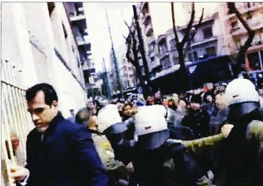
Ο θάναος Πλεύρης εισέρχεται στο υπουργείο Υγείας υπό τις άγριες αποδοκιμασίες των συγκεντρωμένων υγειονομικών

Την ίδια ώρα, σε μια μάλλον ασυνήθιστη κίνηση για τον ίδιο, ο -γνωστός για το μίσος του κατά των ανεμβολίαστων- καθηγητής Πνευμονολογίας του ΕΚΠΑ Θεόδωρος Βασιλακόπουλος εξέφρασε δημόσια τη διαφωνία του, «καρφώνοντας» μάλιστα την κυβέρνηση πως προχωράει σε αυτό το μέτρο για λόγους προεκλογικούς. «Εγώ θα διαφωνούσα με την προσέγγιση του κ. Μαγιορκίνη. Μου θυμίζει περισσότερο ότι πλησιάζουν εκλογές, αν γίνει κάτι τέτοιο, οπότε δεν πρέπει να 'ναι κανείς δυσαρεστημένος στη χώρα μας» είπε. Ειδικότερα ο καθηγητής ανέφερε ότι, ακόμα και με τη μετάλλαξη Ομικρον, οι πιθανότητες κάποιος να έχει τον ιό και να τον μεταδώσει είναι διπλάσιες, αν είναι ανεμβολίαστος, και συνεπώς δεν είναι ιδιαίτερα σωστό να είναι όλα ελεύθερα για όλους. Επανελάβε πως, αν γίνει κάτι τέτοιο, θα γίνει για λόγους πολιτικής επιλογής «και όχι γιατί υγειονομικά είναι το σωστό».