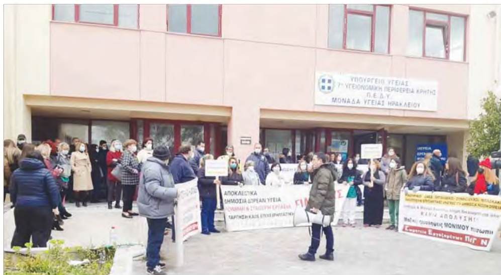
Χθες, οι εργαζόμενοι πραγματοποίησαν κινητοποίηση στην 7η Υ.ΠΕ. στο Ηράκλειο, ενώ στις 6 του Απριλίου συμμετέχουν στην πανελλαδική απεργία που προκήρυξαν η ΓΣΕΕ και η ΑΔΕΔΥ.

■ "Στα κάγκελα" για άλλη μια φορά οι εργαζόμενοι του ΠΑΓΝΗ - Κινητοποιήσεις σε πανελλαδικό επίπεδο και "πυρά" κατά της κυβερνητικής πολιτικής