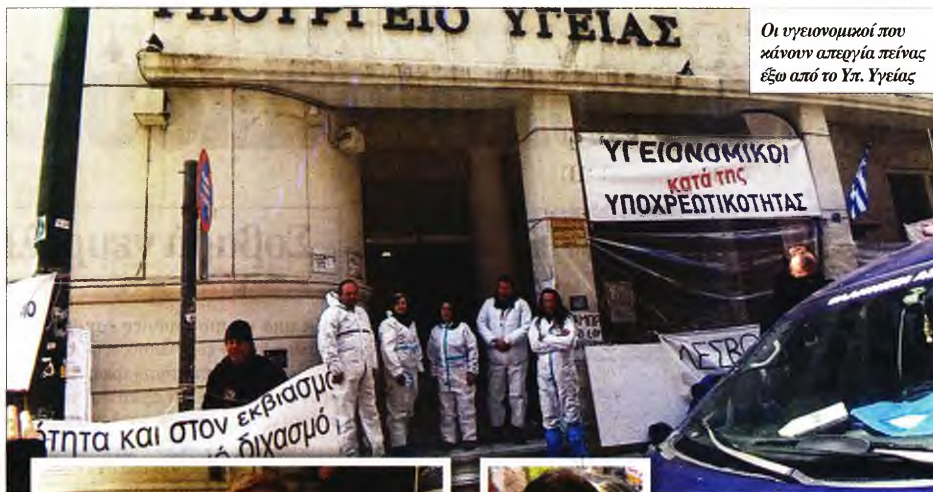
Οι υγειονομικοί που κάνουν απεργία πείνας έξω από το Υπ. Υγείας

«Τα ΜΜΕ μας απαξιώνουν και ο κόσμος δεν γνωρίζει τον αγώνα μας»