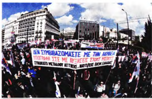
πόθεση τη μάχη για την απεργία, ώστε να αποτελέσει εργατήριο για την κλιμάκωση των αγώνων μας».

Την ίδια ώρα, με τον ιμπεριαλιστικό πόλεμο, τα ναύλα για τη μεταφορά LNG καταγράφουν κέρδη χωρίς προηγούμενο. Παράλληλα, κρατούν ναυτεργάτες εγκλωβισμένους στα πλοία, ενώ συνάδεφκοι μας που είναι σε πλοία που ταξιδεύουν στη Μαύρη Θάλασσα είναι σε άμεσο κίνδυνο. Για όλα αυτά καλούμε τους ναυτεργάτες να κάνουν δική τους υ-