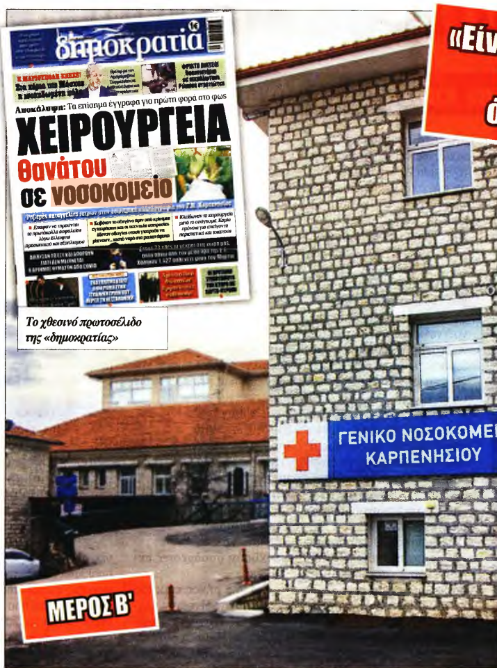
Το χθεσινό πρωτοσέλιδο της «δημοκρατίας»

Βρήκαν λοιπόν έναν εύκολο αποδοιοπομπάιο τράγο, περνώντας το μήνυμα προς τον