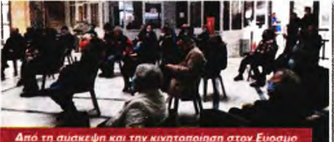
Από τη σύσκεψη και την κινητοποίηση στον Εύοσμο

Με εντατικούς ρυθμούς προετοιμάζεται η απεργία και στη Θεσσαλονίκη από τα εργατικά σώματα, όπως και η απεργιακή συ-γκέντρωση που θα γίνει στις 11 το πρωί στο Αγαλία Βενιζέλου. Υπενθυμίζεται ότι το Σωματείο Εργαζομένων Τουριστών Επισιτιστικών Επιχειρήσεων Θεσσαλονίκης - Περίας - Χαλκιδικής (ΣΕΤΕΠΕ) καλεί σε προσηκνύουσα στις 10 π.μ., στην πλατεία Αριστοτέλους.