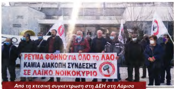
Από τη χθεσινή συγκέντρωση στη ΔΕΗ στη Λάρισα

Στην Καρδίτσα συνεχίστηκαν και χτες οι εξορμήσεις σε χώρους δουλειάς, ενώ σήμερα το Σωματείο Οικοδόμων, το Παράρτημα του ΠΜΣ, ο Σύλλογος Φοιτητών Κτηνιατρικής και η Επιτροπή Ειρήνης διοργανώνουν αντιπολεμική συναυλία στις 7.30 μ.μ. στην κεντρική πλατεία. Τη συμμετοχή τους στην απεργιακή συγκέντρωση ετοιμάζουν και οι αγρότες, απαιτώντας μέτρα για τη μείωση του κόστους παραγωγής και αναδεικνύοντας το αίτημα για την άμεση καταβολή της συνδεδεμένης ενίσχυσης στο βαμβάκι σε 400 περίπου βαμβάκοπαραγωγούς.