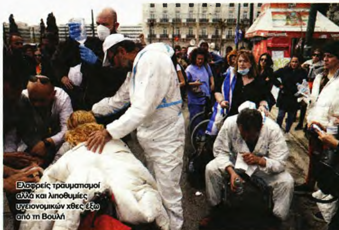
Ελαφρείς τραυματισμοί αλλά και λιποθυμίες υγειονομικών χθες έξω από τη Βουλή