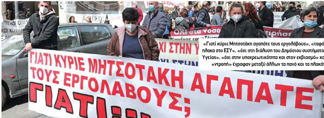
«Γιατί κύριε Μητσοτάκη αγαπάτε τους εργολάβους», «απόπλακα στο ΕΣΥ», «όχι στη διάλυση του Δημοσίου συστήματος Υγείας», «όχι στην υποχρεωτικότητα και στον εκβιασμό» και «ντροπή» έγραφαν μεταξύ άλλων τα πανό και τα πλακάτ.