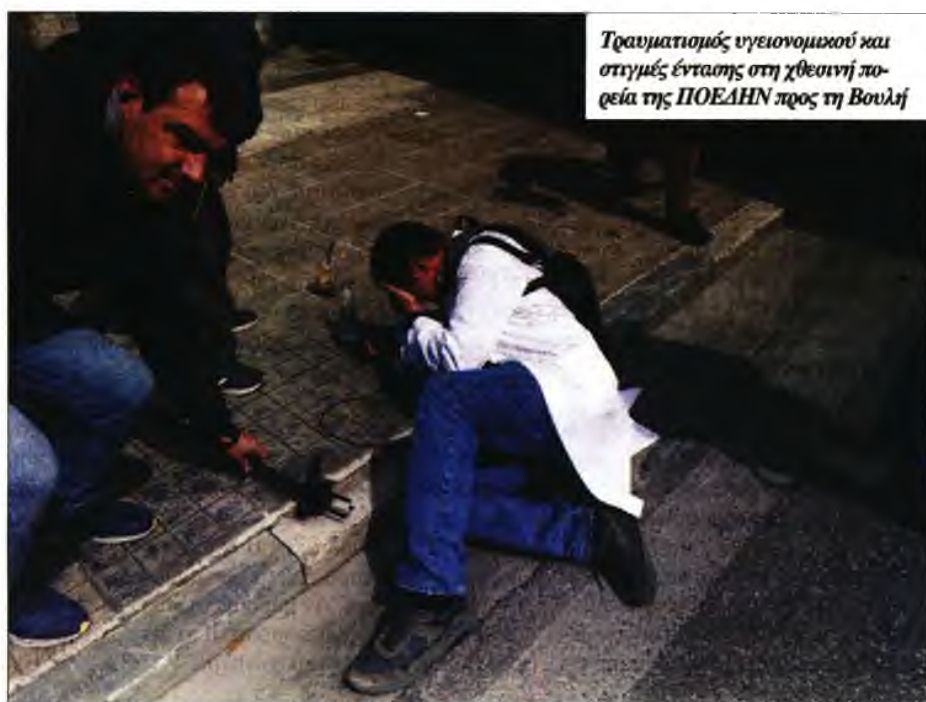
Τραυματισμός υγειονομικού και στιγμές έντασης στη χθεσινή πορεία της ΠΟΕΔΗΝ προς τη Βουλή