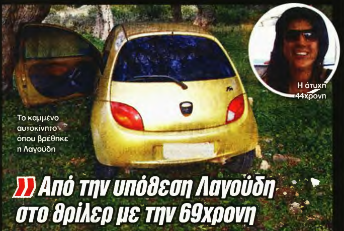
Το καμμένο αυτοκίνητο όπου βρέθηκε η Λαγούδη

« Από την υπόθεση Λαγούδη στο θρίλερ με την 69χρονη