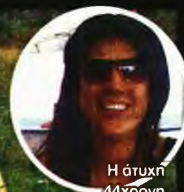
Η άτυχη 44χρονη