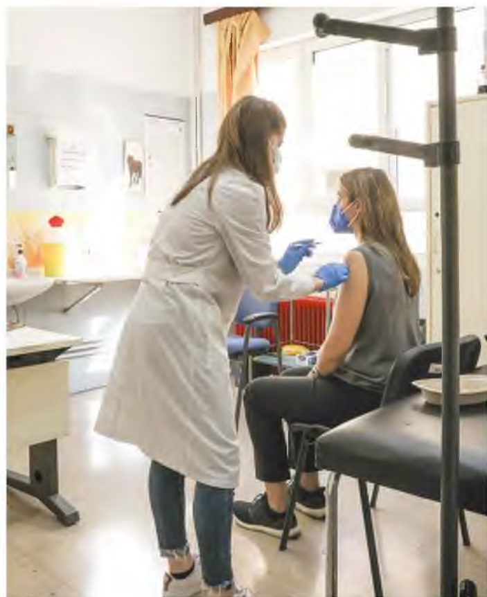
Για τα άτομα που έχουν νοσήσει με COVID-19 αφότου έχουν κάνει και την τρίτη δόση δεν συνιστάται η τέταρτη δόση του εμβολίου . Παράλληλα, η επιτροπή αποφάσισε να συνιστάται η τέταρτη δόση και σε παιδιά και εφήβους 12 έως 17 ετών με ανοσοκαταστολή και νοσήματα υψηλού κινδύνου.

Τέλος, σε αλλαγές προχώρησε η επιτροπή και όσον αφορά τον βασικό εμβολιασμό έναντι της COVID-19 (δύο δόσεις). Ει-