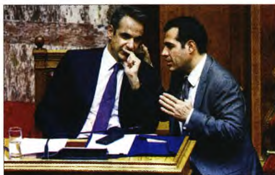
Ο Κυριάκος Μητσοτάκης με τον Θάνο Πλεύρη

■ Οι ασθενείς θα χρεώνονται για ιατρική και χειρουργεία, ενώ μπαίνει «κόφτης» στην ελεύθερη πρόσβαση στα νοσοκομεία