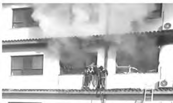
Η πυρκαγιά ξέσπασε σε θάλαμο όπου νοσηλεύονταν τρεις ασθενείς

μετέβησαν εκτάκτως ο υπουργός Υγείας Θάνος Πλεύρης, η αναπληρώτρια υπουργός Μίνα Γκάγκα καθώς και ο πρόεδρος του ΕΚΑΒ