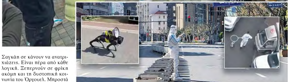
Ρομπότ-σκύλοι εφορμούν στους δρόμους της Σαγκάης εποπτεύοντας την πρωτόγνωρη καραντίνα που έχουν επιβάλει οι Αρχές για έλεγχο της πανδημίας

Σαγκάη σε κάνουν να ανατριχιάζει. Είναι πέρα από κάθε λογική. Ξεπερνούν σε φρίκη ακόμη και τη δυστοπική κοινωνία του Όργουελ. Μπροστά σου έρχονται ειδήσεις που λένε ότι οι κάτοικοι της Σαγκάης έχουν στραφεί στο Διαδίκτυο μέχρι και για ιατροφαρμακευτική βοήθεια, γιατί οι περιορισμοί που τους έχουν επιβάλει δεν τους επιτρέπουν την πρόσβαση σε υπηρεσίες υγειονομικής φροντίδας. Όσοι νοσοούν από άλλες ασθένειες κάνουν εκκλήσεις για βοήθεια σε πλατφόρμες αμοιβαίας αρωγής και σε διαδικτυακά φόρουμ. Και όσο και παράλογα και νοσηρά να φαντάζουν όλα αυτά είναι πραγματικότητα. Γίνονται τώρα!