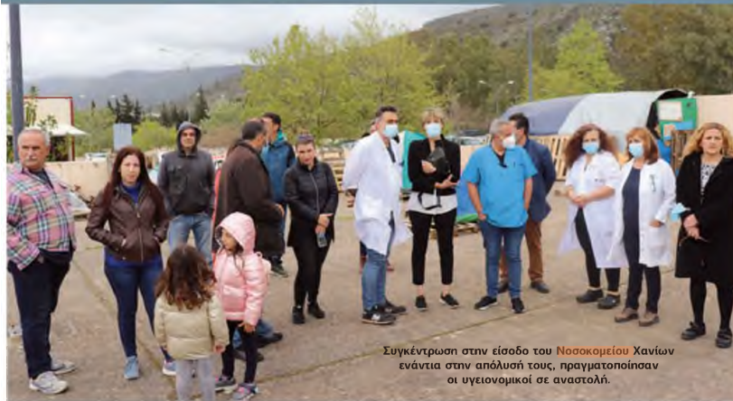
Συγκέντρωση στην είσοδο του Νοσοκομείου Χανίων ενάντια στην απόλυσή τους, πραγματοποίησαν οι υγειονομικοί σε αναστολή.

» Συγκέντρωση χθες στην πύλη του Νοσοκομείου