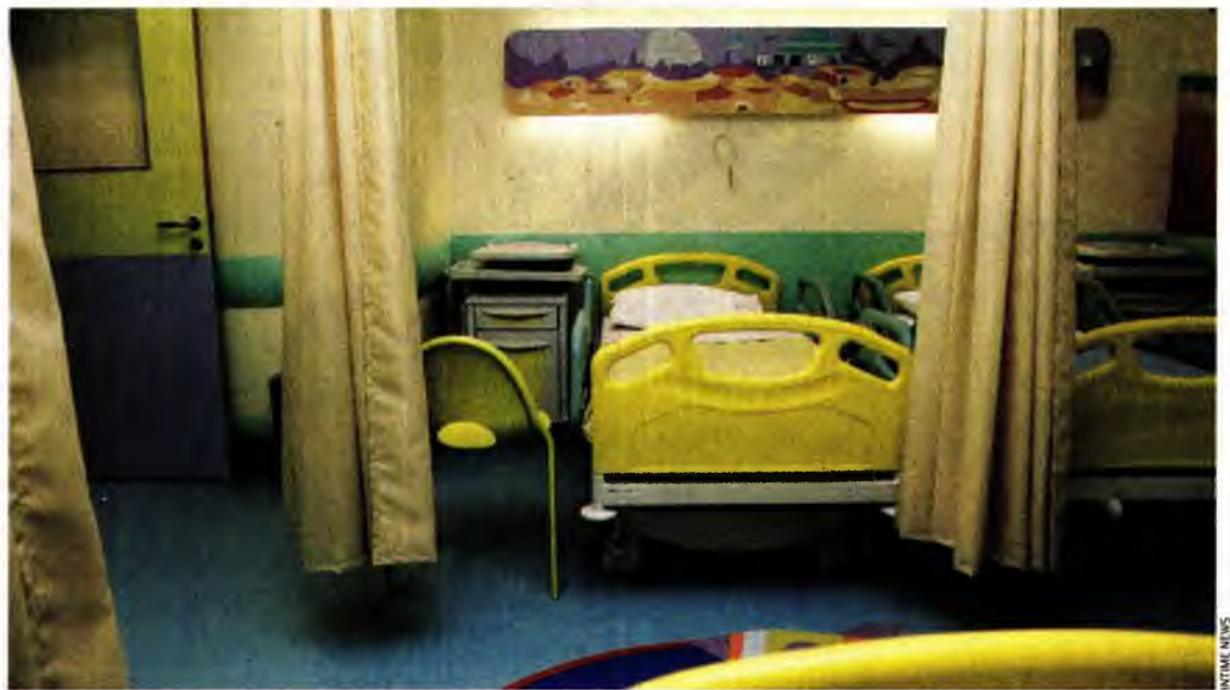
Αν και υπάρχουν κάποιες –λίγες– περιπτώσεις παιδιών με συμπτώματα ηπατίτιδας που διερευνώνται τις τελευταίες ημέρες, δεν πληρούν τα κριτήρια που έχει θέσει ο ΕΟΔΥ.

Σύμφωνα με τις επίσημες οδηγίες του ΕΟΔΥ, ως πιθανό κρούσμα ορίζεται κάθε άτομο ηλικίας κάτω των 16 ετών που εμφανίζεται με τρανσαμινάσες ορού μεγαλύτερες των 500 IU/L (AST ή