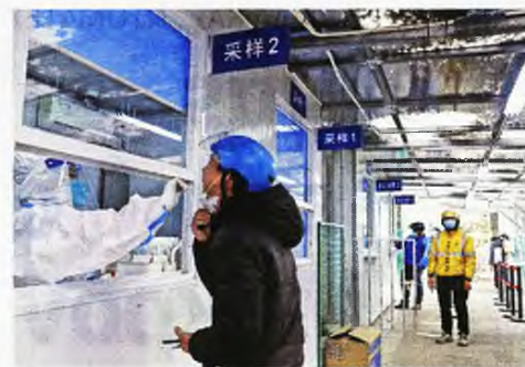
Το Πεκίνο έχει θέσει ως προτεραιότητα τη διεξαγωγή διαγνωστικών τεστ με στόχο να εντοπίζει άμεσα τα κρούσματα και να τα απομονώνει. Εν τω μεταξύ, η πρόεδρος της Κομισιόν έδωσε έμφαση στη συμβολή των στοχευμένων διαγνωστικών τεστ.