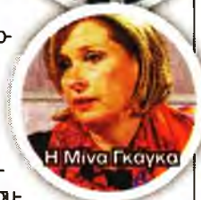
Η Μίρα Γκάγκα

Αντιδράσεις σχεδόν στο σύνολο του υγειονομικού κόσμου έχει προκαλέσει το νομοσχέδιο των Πλειούρα - Γκάγκα για την αναδιάρθρωση των δομών Υγείας. Η κυβέρνηση μπορεί να μιλάει για «νοικοκύρεμα», «εξορθολογισμό των δαπανών», «αντιμετώπιση της σπατάλης» και «πθικοποίηση του συστήματος Υγείας», όμως οι υγειονομικοί το χαρακτηρίζουν ως ένα αντιδραστικό νομοσχέδιο, το οποίο βάζει τους ιδιώτες στο ΕΣΥ, μετατρέπει τον ΕΟΠΥΥ σε ιδιωτικό ασφαλιστικό οργανισμό με παροχές σε ανταποδοτική βάση και θεσμοθετεί τα απογευματινά χειρουργεία, όπου η λίστα αναμονής θα παρακάμπεται από όσους διαθέτουν χρήματα.