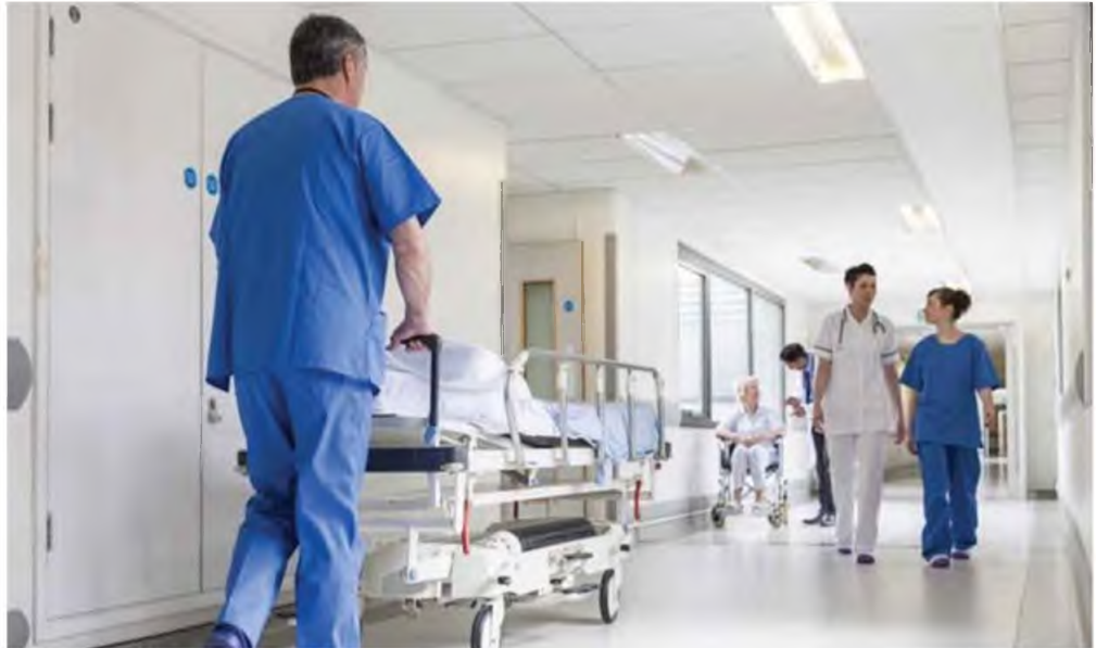
Παρά τις αλλαγές, που κάποιες προειδεάζουν σε εκσυγχρονισμένα συστήματα υγείας, όπως είναι ο προσωπικός ιατρός, γιατροί και πρόεδροι σωματείων Δ.Σ. νοσοκομείων κάνουν λόγο για ένα δημόσιο Σύστημα Υγείας που θα ιδιωτικοποιηθεί.