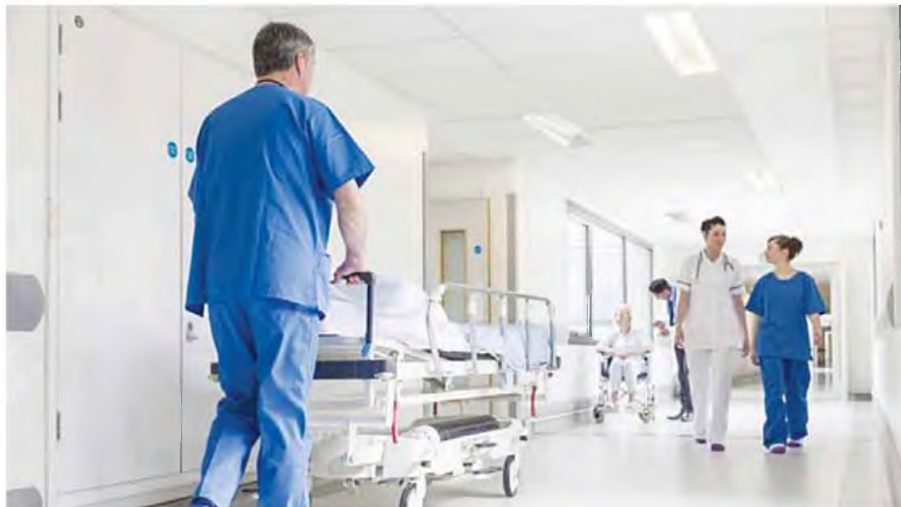
Έκοντας σηκώσει το βάρος της αντιμετώπισης όλων των πανδημικών κυμάτων, οι νοσηλεύτριες ζητούν αναγνώριση του έργου τους μέσα από συγκεκριμένες πολιτικές και κινήτρα.