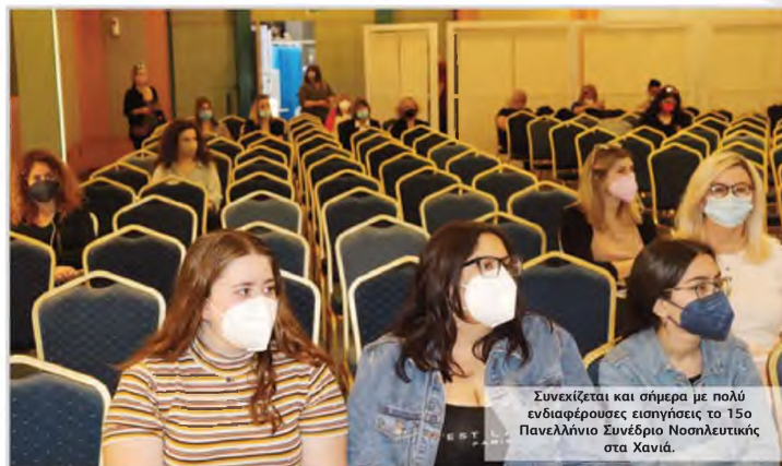
Συνεχίζεται και σήμερα με πολύ ενδιαφέρουσες εισηγήσεις το 15ο Πανελλήνιο Συνέδριο Νοσηλευτικής στα Χανιά.

Παρουσίασε τη διαδικασία καταγραφής, την προετοιμασία των χώρων υποδοχής με συντονιστές γιατρούς και νοσηλευτές, την εκτίμηση της επάρκειας των υποδομών, το πρώτο επιχειρησιακό σχέδιο για την υποδοχή των περιστατικών κορωνοϊού, το οργανόγραμμα και τις ασκήσεις ετοιμότητας, την εκπαίδευση του προσωπικού, τη σύσταση της ομάδας διαχείρισης covid. Ξεκίνησε μια ιστορική αναδρομή της πανδημίας από τις 26/2 / 2020 όταν καταγράφηκε το πρώτο κρούσμα στην Ελλάδα και συνέχισε λέ-