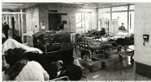
Ράντζα στους διαδρόμους η «τιμή» στη «Μέρα Νοσηλευτή»

Εικόνες σαν αυτές με τα φορεία στους διαδρόμους έξω από τις Παθολογικές Κλινικές μετά τη χτεσινή γενική εφημερία του «Ευαγγελισμού», το επιβεβαιώνουν με τον πιο τραγικό τρόπο. Η πραγματικότητα που βιώνουμε είναι αμείλικτη - 2 νοσηλευτές είναι υπεύθυνοι για τη φροντίδα έως και 70 ασθενών στα τμήματα, 1 νοσηλευτής για 4 ασθενείς στη ΜΕΘ ανά βάρδια - όταν ειδικά η αναλογία για το τελευταίο θα έπρεπε να είναι η αντίστροφη! Στον «Ευαγγελισμό», την πολυδιαφημιζόμενη «ναυαρχίδα του ΕΣΥ» πολύ πάνω από το 35% των συναδέλφων νοσηλευτών εργάζονται με συμβάσεις με ημερομηνία λήξης, με πολλούς από αυτούς να αποθαρρύνονται από τις διαρκώς επιδεινούμενες συνθήκες εργασίας και