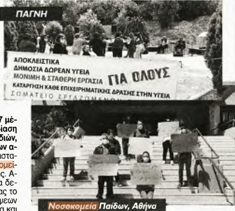
Νοσοκομείο Παιδών, Αθήνα

Σε συγκέντρωση διαμαρτυρίας στον προαύλιο χώρο προχώρησαν εργαζόμενοι και στα Νοσοκομεία Παιδών «Η Αγία Σοφία» και «Π. & Α. Κυριακού», με πρωτοβουλία συνδικαλιστών που συσπειρώνονται στο ΠΑΜΕ. Το υπουργείο Υγείας από την πλευρά του «τίμησε» τους νοσηλευτές στέλνοντας ελεγκτικό κλιμάκιο, προκειμένου να διαπιστωθεί «αν οι εργαζόμενοι κάνουν σωστά τη δουλειά τους» και «αν λειτουργούν βάσει των προτύπων του εξωτερικού». Την ίδια στιγμή, στην Παθολογική κλινική στην πρωινή βάρδια υπηρετούν μόνο 4 νοση-