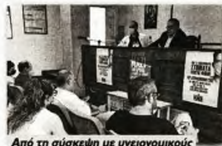
Από τη σύσκεψη με υγειονομικούς

Παρουσιάζοντας τις θέσεις του ΚΚΕ για την Υγεία, την Πρωτοβάθμια Φροντίδα και την Πρόληψη, επεσήμανε: «Η πολιτική που αντιμετω-