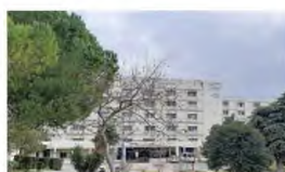
Το Πανεπιστημιακό Νοσοκομείο Πατρών

► ΣΤΟΝ «ΑΓΙΟ ΑΝΔΡΕΑ» , που μέσα στην πανδημία σπίκωσε δυσανάλογα μεγαλύτερο φορτίο σε σχέση με το προσωπικό και τις