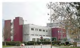
Ο «Άγιος Ανδρέας»