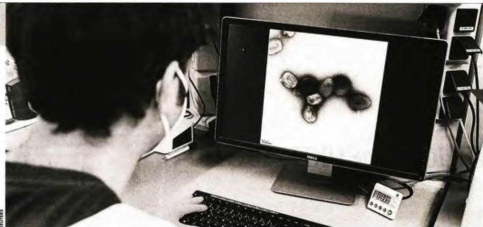
Έρευνες διεξάγει η εταιρεία Bavarian Nordic για την ανάπτυξη εμβολίου κατά της ευλογιάς των πιθήκων