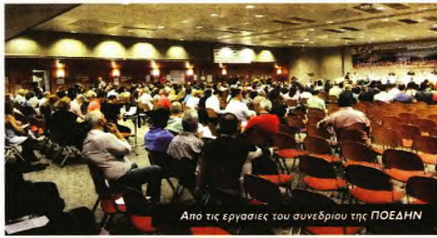
Απο τις εργασίες του συνεδρίου της ΠΟΕΔΗΝ

«Παίρνοντας την ευθύνη να περιφρουρήσουμε όλους τους