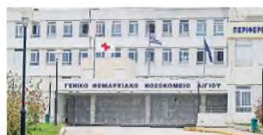
Το Νοσοκομείο Αγίου

υποδομές του, η υποστελέχωση που επιδεινώθηκε λόγω των ομαδικών παραιτήσεων και των αναστολών εργασίας αποτελεί το μεγαλύτερο εμπόδιο στην προσπάθεια επαναφοράς στην πρότερη λειτουργία (σημ: Τη διετία 2020-21 μειώθηκαν κατά 21% οι χειρουργικές επεμβάσεις, με αποτέλεσμα 2760 ασθενείς, είτε να ωθούνται στον ιδιωτικό τομέα, είτε να αφήνονται στην τύχη τους). Στην Παθολογική, οι νέες μαζικές παραιτήσεις ειδικευμένων δημογυργών εκρακτικό πρόβλημα, σε συνδυασμό με τις μετακινήσεις επιμελητών στον Πύργο. Η λειτουργία της ΜΕΘ συνεχίζει να λειτουργεί κάτω από τα όρια ασφαλείας, λόγω της τραγικής έλλειψης προσωπικού.