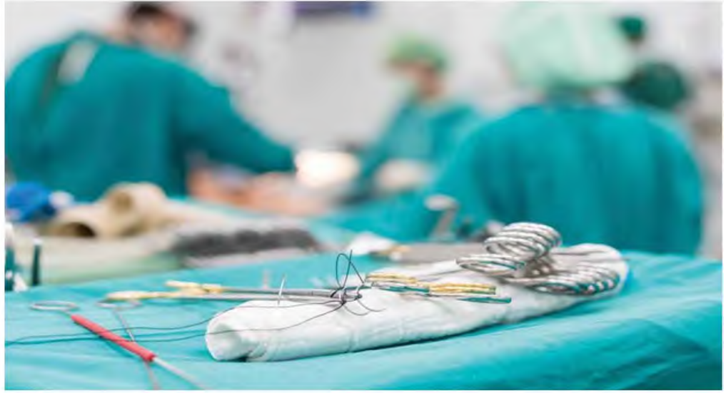
Στις λίστες χειρουργείου του ΠΑΓΝΗ βρίσκονται περισσότεροι από 5.500 ασθενείς, με την αναμονή για τις τακτικές χειρουργικές επεμβάσεις να είναι πολύμηνη.

Η προσπάθεια επαναφοράς της λειτουργίας του νοσοκομείου βρίσκει τους γιατρούς και τους νοσηλευτές του Ανασθησιολογικού λιγότερους σε σχέση με πριν την πανδημία. Ωστόσο, η διοίκηση του ΠΑΓΝΗ πιέζει για άμεση λειτουργία και των εννιά χειρουργικών τμήματων, χωρίς ενίσχυση του τμήματος με μόνιμο προσωπικό, ακόμη κι αν αυτό συνεπάγεται περικοπή αδειών και ρεπό του εξαντλημένου ανεπαρκούς (αριθμητικά) προσωπικού και περιορισμό βασικών δραστηριοτήτων του Ανασθησιολογικού Τμήματος», αναφέρουν στην ανακοίνωσή τους οι εργαζόμενοι στο Ανασθησιολογικό και το Χειρουργικό Τμήμα του ΠΑΓΝΗ.