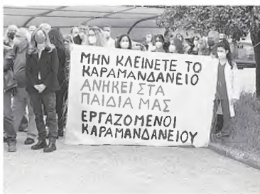
Από την κινητοποίηση του Απριλίου. Αύριο πάμε για βερίνη αντίστοιχη, πιο γενικευμένη. Αλλά το υπουργείο αισιοδοξεί