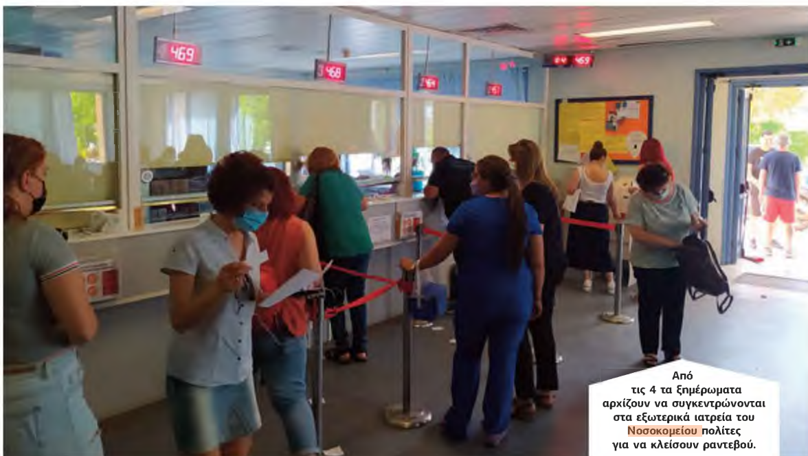
Από τις 4 τα ξημερώματα αρχίζουν να συγκεντρώνονται στα εξωτερικά ιατρεία του Νοσοκομείου πολίτες για να κλείσουν ραντεβού.

ήδη 40 άτομα για να κλείσουν ραντεβού, όταν άνοιξαν τα γκισέ στις 7 το πρωί είχαν μαζευτεί πάνω από 100 άτομα. Και όλα αυτά για μια οφθαλμολογική εξέταση!» μας δήλωσε χαρακτηριστικά πολίτης που βρέθηκε χθες στο Νοσοκομείο Χανίων, ενώ άλλος μας τόνισε πως ήταν αδύνατο να βρει ραντεβού για το γαστρεντερολογικό καθώς δεν υπάρχει διαθεσιμότητα για αρκετούς μήνες.