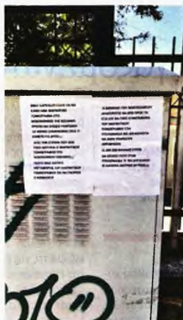
Καταγγέλλει για τον μαγνητικό τομογράφο στο «Μαμάτσειο» της Κοζάνης

Στην Κοζάνη δεν έχουν ακτινολόγο για να διαβάζει τις μαγνητικές τομογραφίες και το νοσοκομείο αδυνατεί να εξυπηρετήσει εξωτερικούς ασθενείς, ενώ στο «Παπανικολάου» στη Θεσσαλονίκη πραγματοποιούν σήμερα κινητοποίηση για την κλινική ΩΡΛ που έχει μείνει με έναν γιατρό