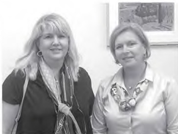
Η αν. υπουργός Μίνα Γκάγκα με την πρόεδρο του Ιατρικού Συλλόγου Άννα Μαστοράκου στη χθεσινή τους συνάντηση

Της ΜΑΡΙΝΑΣ ΡΙΖΟΓΙΑΝΝΗ rizogianni@pelop.gr