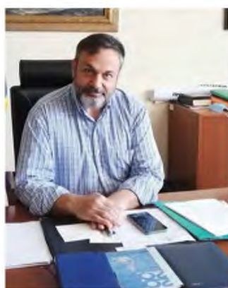
Υπηρεσιών Υγείας και Εκπαίδευσης. ζ. Δημιουργήθηκε Γραφείο Εσωτερικού Έλεγχου.

η. Ξεκίνησαν οι διαδικασίες για την κάλυψη της κενής θέσης Νομικού Συμβούλου με πάγια αντιμισθία.