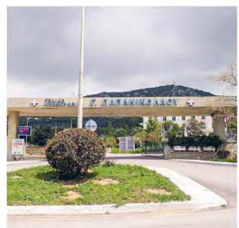
Οι εκπρόσωποι των γιατρών και του προσωπικού νοσοκομείων της Θεσσαλονίκης κατήγγειλαν τη διάλυση της ΔΡΑ κλινικής του νοσοκομείου Παπανικολάου, στην οποία θα μείνει στο τέλος του τρέχοντος μηνός μονάχα ένας μόνιμος γιατρός.

Εν τω μεταξύ, πλέον η πίεση της COVID-19 στο ΕΣΥ έχει χαλαρώσει σε σημαντικό βαθμό. Χθες οι διασωληνωμένοι ασθενείς με COVID-19 ήταν 119, ενώ καταγράφηκαν και 95 νέες εισαγωγές για νοσηλεία ασθενών που είχαν προσβληθεί από τον κορωνοϊό στα νοσοκομεία της επικράτειας. Την Κυριακή το ποσοστό κλήψης των απλών κλινικών που έχουν δεμευθεί για ασθενείς με COVID-19 ήταν στο 24,5% και των αντίστοιχων κλινικών ΜΕΘ στο 32,25%. Ο ΕΟΔΥ ανακοίνωσε 2.501 νέα εργαστηριακά επιβεβαιωμένα κρούσματα της νόσου, εκ των οποίων τα 300 ήταν επαναμιώξεις, ενώ δηλώθηκαν και 10 θάνατοι ασθενών με COVID-19. Από την έναρξη της επιδημίας έχουν καταγραφεί στη χώρα μας συνολικά 29.927 θάνατοι από ασθενείς που είχαν προσβληθεί από τον ιό.