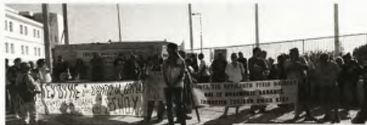
Από τη συγκέντρωση στο Νοσοκομείο της Χίου

«Εκτακτες» ανάγκες επικαλέστηκε ο διοικητής του Νοσοκομείου Παίδων «Αγία Σοφία», στη συνάντηση που είχε με το Σωματείο Εργαζομένων του Παίδων «Αγλαΐα Κυριακού» και της 5μελούς Επιτροπής της ΕΙΝΑΠ από το «Αγία Σοφία», στις εύλογες διαμαρτυρίες τους για τα «εντέλλεσθε» μετακινήσεων των ελάχιστων παιδοαναισθησιολόγων που υπηρετούν στα τρία Παίδων της Αττικής προς το «Καραμανδάνειο» Νοσοκομείο της Πάτρας. Η κινητοποίηση στη διοίκηση έγινε στο πλαίσιο στάσης εργασίας.