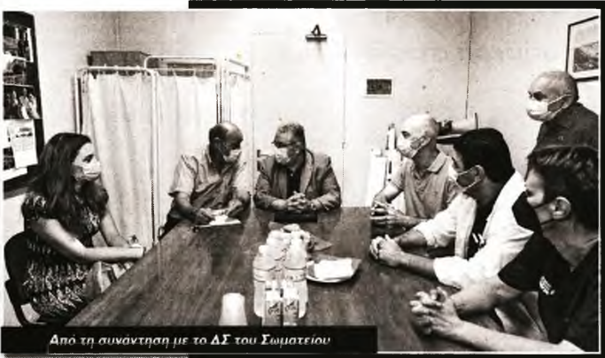
Από τη συνάντησή με το ΔΣ του Σωματείου

Ο ι μεγάλες ελλείψεις σε προσωπικό και τα προβλήματα που προκαλούν στη λειτουργία του νοσοκομείου η υποχρηματοδότηση, η εργολαβιοποίηση των υπηρεσιών και οι δύσκολες συνθήκες μέσα στις οποίες οι εργαζόμενοι έδωσαν και εξακολουθούν να δίνουν τη μάχη για την προστασία της υγείας του λαού, τόσο στη διάρκεια της πανδημίας όσο και αυτήν την περίοδο, που σταδιακά τα νοσοκομεία παύουν να λειτουργούν ως μονοθεματικά, αναδείχθηκαν στις δύο περιόδους της επίσκεψης του ΓΓ της ΚΕ του ΚΚΕ Δημήτρη Κουτσούμπα στο πανεπιστημιακό νοσοκομείο ΑΧΕΠΑ της Θεσσαλονίκης την περασμένη Παρασκευή 10 Ιουνίου.