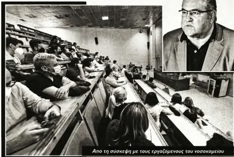
Από τη συσκέψη με τους εργαζομένους του νοσοκομείου

Ο Δημήτρης Κουτσούμπας αναφέρθηκε και στην εμπλοκή της χώρας στον πόλεμο , σημειώνοντας: «Το τρίτο κρίσιμο ζήτημα - εκτός από τα άλλα - είναι το ζήτημα του πολέμου και της στάσης απέναντι σε αυτό με την εμπλοκή της Ελλάδας. Γιατί άλλο ζήτημα είναι να καταδικάσεις τη ρωσική εισβολή, να καταδικάσεις τον θάνατο, την αιματοχυσία που γίνεται, να σταθείς αλληλέγγυος με φάρμακα, αν χρειάζεται ο λαός που υποφέρει - όποιος κι αν είναι αυτός, πριν ο ουρσικός, οι υπόλοιποι λαοί στη Μέση Ανατολή που είχαν πολέμους, ο γιογκοσλάβικος πιο πριν, εδώ στο κέντρο της Ευρώπης, τώρα ο ουκρανικός - και είναι άλλο να στέλνεις οπτικά συστήματα. Και δεν είναι μόνο τα Καλάσνικoff, έχουν γίνει δέκα αποστολές μέχρι στιγμής, όπως καταγγείλαμε επίσημα στη Βουλή, και ο Παναγιώτπουλος, ο υπουργός Άμυνας, δεν είπε τίποτα για αυτό. Λέει ότι "δεν μπορώ να τα πω δημόσια", πράγματα που είναι δημοσιευμένα και στο site της ουκρανικής προέβρασης στην Αθήνα, σε εκθέσεις που έχουν δοθεί στο ΝΑΤΟ, στο οποίο συμμετέχουν και οι Τούρκοι, αφού είμαστε σύμμαχοι και τα έχουν στα χέρια τους. Μιλώ για πλήρη εμπλοκή, εκτός από τους αξιωματικούς των Ενόπλων Δυνάμεων, που έχει στείλει στη Βουλγαρία και σε χώρες περιμετρικά γύρω από την Ουκρανία και τη Ρωσία, στο πλαίσιο της επιθετικής πολιτικής του ΝΑΤΟ για περικύκλωση της Ρωσίας. Αρα, είναι κρίσιμο ζή-