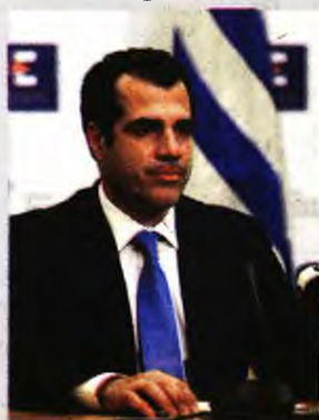
«Το θερινό κύμα πιστεύουμε ότι είναι ένα κύμα που θα έχει αυξημειώσεις», ανέφερε ο υπουργός Υγείας.

ΑΥΞΑΝΕΤΑΙ η διασπορά των υποπαρалаλαγών «Ομικρον 4» και «Ομικρον 5» στη χώρα μας και ανεβαίνουν τα κρούσματα κορονοϊού. Τα θετικά στις δύο νέες υποπαρалаλαγές δείγματα παρουσιάζουν αύξηση κατά 145% σε σχέση με την προηγούμενη εβδομάδα, με την κινητικότητα του ιού να αναζωπυρώνεται. Η Ελλάδα έχει, όπως όλα δείχνουν, μπροστά της ένα θερινό κύμα, όπως είπε και ο υπουργός Υγείας , Θάνος Πλεύρης, ωστόσο ειδικό και κυβέρνηση ελπίζουν πως θα είναι διαχειρίσιμο ως προς τις νοσηλείες και την πίεση στο ΕΣΥ.