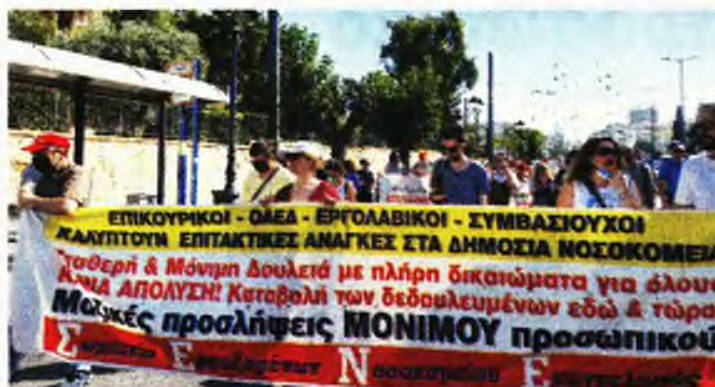
Από τη συγκέντρωση στην Αθήνα

Σημειώνεται ότι κάτω από το βάρος της πίεσης των αντιδράσεων και των αλληλεπλληλών παρεμβάσεων, εκπρόσωποι της ΟΕΝΓΕ ενημερώθηκαν στη διάρκεια της κινητοποίησης ότι τελικά εκταμιεύτη-