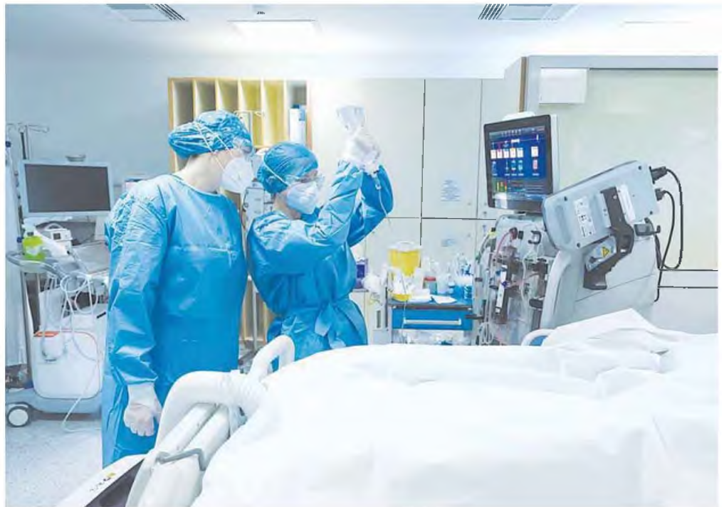
Ο ΕΟΔΥ ανακοίνωσε τα τελευταία 24ωρα 1.003 νέες επιμολύνσεις στο νησί, εκ των οποίων περισσότερες από τις μισές, ήτοι 510, εντοπίστηκαν στο Ηράκλειο.

■ «Αναμενόμενη αλλά ελεγχόμενη» η αύξηση των νοσηλείων λόγω COVID, λέει ο υπουργός Υγείας - «Βιαστική» η άρση των περιοριστικών μέτρων, επιμένουν οι επιστήμονες