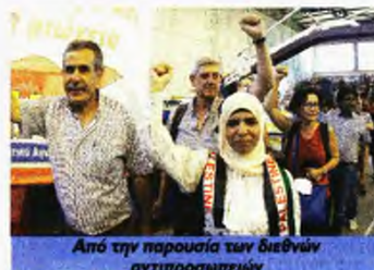
Από την παρουσία των διεθνών αντιπροσωπειών

Τον λόγο πήραν πάνω από 100 συνδικαλιστές, μεταφέροντας πείρα από τη δράση για την οργάνωση της πάλης στους χώρους δουλειάς. Κοινή διαπίστωση ήταν ότι μετά από πολλά χρόνια σε μια τέτοια πανελλαδική συνάντηση «όλοι είχαν κάτι να πουν και όλοι είχαν να ακούσουν», αφού τα τελευταία χρόνια πράγματι έχουν γίνει σημαντικές εργατικές κινητοποιήσεις σε μεγάλους χώρους δουλειάς και κλάδους.