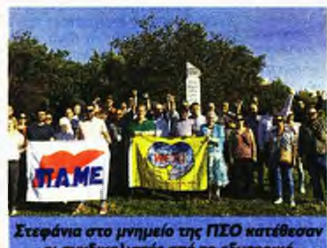
Στεφάνια στο μνημείο της ΓΣΕΟ κατέβασαν οι συνδικαλιστές από το εξωτερικό