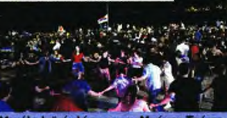
Μεγάλο λαϊκό γλέντι με τον Μπάμπη Τσέρτο πραγματοποιήθηκε το βράδυ της πρώτης μέρας

πέδωσης των εργατικών και συνδικαλιστικών δικαιωμάτων. Μια φουρνιά που με τη συμμετοχή της στα συνδικάτα και από θέσεις ευθύνης ενισχύει την πίστη στην οργανωμένη συλλογική δράση, κόντρα στη μοιρολατρία και την υποταγή, δείχνει ότι οι αγώνες που δόθηκαν σε συνθήκες φαινομενικής αδράνειας έπιασαν τόπο.