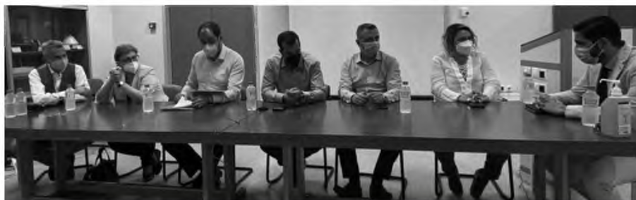
• ΣΥΣΚΕΨΗ ΤΟ ΣΑΒΒΑΤΟ ΣΤΟ Ν. ΡΕΘΥΜΝΟΥ ΠΑΡΟΥΣΙΑ ΤΟΥ ΥΠΟΥΡΓΟΥ ΥΓΕΙΑΣ • ΣΤΟ ΕΠΙΚΕΝΤΡΟ Η ΣΤΕΛΕΧΩΣΗ ΜΕ ΑΝΑΙΣΙΟΛΟΓΟΥΣ ΚΑΙ ΤΑ ΤΑΚΤΙΚΑ ΧΕΙΡΟΥΡΓΕΙΑ

Στην στελέχωση των Νοσοκομείων , μεταξύ των οποίων και του Νοσοκομείου Ρεθύμνου με κρίσιμες ειδικότητες όπως αυτή των αναισθησιολόγων και την αναβάθμιση του υλικοτεχνικού εξοπλισμού, στρέφει το βλέμμα το Υπουργείο Υγείας, προκειμένου να δοθούν λύσεις και νέες προοπτικές αλλά κυρίως κίνητρα στο ΕΣΥ.