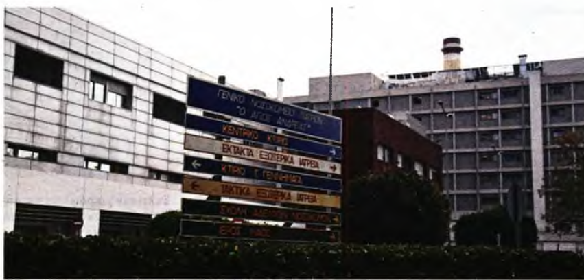
ΕΥΡΥΤΑΚΤΑ ΕΣΤΙΟΝΟΜΙΑ ΜΠΕΡΑ

Το λυπηρό γεγονός φαίνεται ότι εκμεταλλεύτηκε ο υπουργός Υγείας για να στραφεί κατά των γιατρών και του υποβαθμισμένου και υποστελεχωμένου ΕΣΥ που, έπειτα από 2,5 χρόνια πανδημίας, δεν μπορεί να κρύψει τις «τρύπες» του και την επικίνδυνη για τη δημόσια υγεία εγκατάλειψή του. Αντί δε για στήριξή του την κρίσιμη ώρα, θυμίζουμε ότι η κυβέρνηση Μητσοτάκη φέρνει το «νέο ΕΣΥ», ένα εγκληματικό σχέδιο που «θα φέρει λουκέτα, συγχωνεύσεις σε κλινικές, τμήματα, ολόκληρα νοσοκομεία, όπου το αν κάποιος και τότε θα χειρουργηθεί θα εξαρτάται από το αν έχει να πληρώσει τα απογευματινά χειρουργεία, που θα αναγκάζονται οι ασθενείς ακόμα και διόδια να πληρώνουν για να βρουν γιατρό και την υγεία τους, μιας και το κριτήριο του κλεισίματος νοσο-