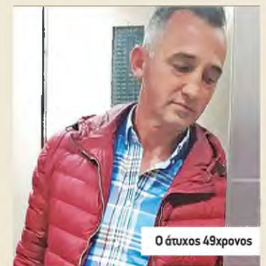
Ο άτυχος 49χρονος

Ο ίδιος τόνισε πως στο νοσοκομείο υπήρχαν 20 γιατροί εκείνη την ώρα και όχι 70, όπως είχε αναφέρει το υπουργείο Υγείας. «Ο διοικητής του νοσοκομείου κατατομήθηκε, το πρόβλημα δεν λύθηκε. Έχουμε περάσει τέσσερις με πέντε ημέρες και σε μέρες που δεν εφημερεύει το νοσοκομείο δεν υπάρχει γιατρός να εφημερεύει», δήλωσε.