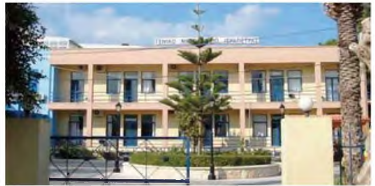
Συμπαράσταση στα σωματεία εργαζομένων των νοσοκομείων Αγ. Νικολάου και Ιεράπετρας

Οι εργαζόμενοι τονίζουμε ότι δεν υποχωρούμε από το αυτονόητο δικαίωμα της υπεράσπισης της υγείας του κρητικού λαού και των δικαιωμάτων των εργαζομένων. Δεν θα μπου-