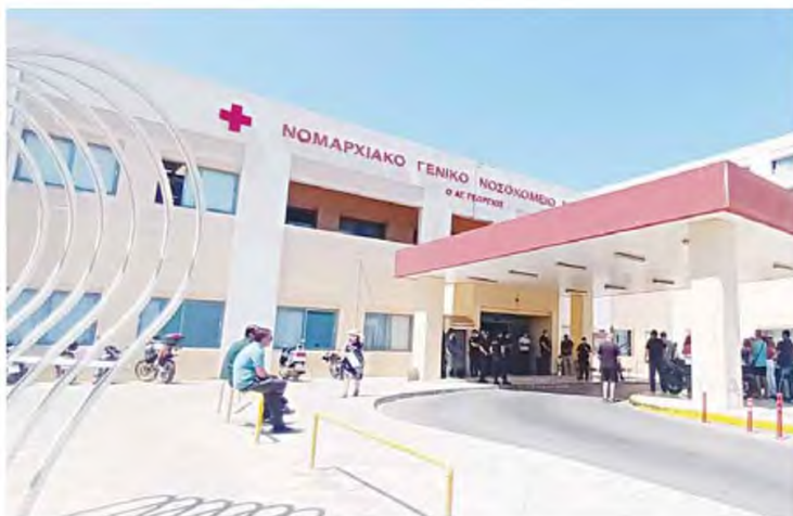
Η αναπληρώτρια υπουργός Υγείας, απαντώντας στην ερώτηση του Παύλου Πολάκη, αναγνώρισε ότι το ΕΣΥ "γεννάει" και οι αποχωρήσεις γιατρών είναι μαζικές, υπεραμύνθηκε ωστόσο των πολιτικών του υπουργείου για την ενίσχυση του Νοσοκομείου Χανίων σε προσωπικό.

“ Η Ορθοπαιδική Κλινική λειτουργεί χάρη στην εξάμηνη παράταση υπηρεσίας που δόθηκε στους προς συνταξιοδότηση, το ΤΕΠ αδειάζει και η Κλινική COVID σάς έστειλε χθες εξώδικο, προκειμένου να ανοίξετε επιτέλους ξανά την Πνευμονολογική Κλινική. Χρειάζεται πια άλλος σχεδιασμός ΠΑΥΛΟΣ ΠΟΛΑΚΗΣ, ΒΟΥΛΕΥΤΗΣ ΣΥΡΙΑΣ ΧΑΝΙΩΝ