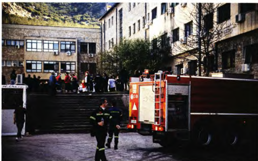
Τέσσερις μήνες μετά την πυρκαγιά στο νοσοκομείο «Παπανικολάου», η αποκατάσταση της πνευμονολογικής κλινικής θα γίνει μόνο εάν... εξευρεθεί χρηματοδότηση, όπως αναφέρεται σε έγγραφο της αν. υπουργού Υγείας Μίνας Γκάγκα (δεξιά)