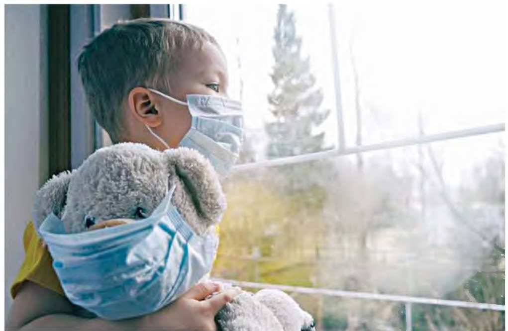
Σύμφωνα με την ΠΟΕΔΗΝ, περισσότερα από 70 παιδιά νοσηλεύονται με κορωνοϊό στα νοσοκομεία της χώρας.

■ Στη Μονάδα Εντατικής Νοσηλείας Νεογνών στα Χανιά με COVID κοριτσάκι λίγων μόλις ημερών