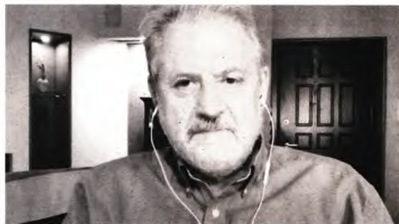
Βάρβαρη η προσέγγιση που θέλει την πανδημία παράπλευρη απώλεια της οικονομίας και του τουρισμού

μένως, η λοιμογόνος δύναμη μπορεί να είναι μικρότερη, αλλά ο ιός δεν έγινε ακίνδυνος. Ούτε ο αριθμός των θανάτων είναι ευκαταφρόνητος.