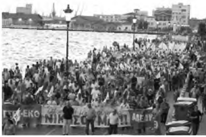
Η κορύφωση των κινητοποιήσεων θα γίνει το Σάββατο 10 Σεπτεμβρίου, ημέρα των εγκαινίων της ΔΕΘ (φωτό αρχείο)

Τ η δική τους απάντηση προετοιμάζουν τα συνδικάτα με τις καθιερωμένες κινητοποιήσεις κατά την ημέρα των εγκαινίων της ΔΕΘ, στη Θεσσαλονίκη. Ήδη οριστικοποιούνται κάποιες οργανωτικές λεπτομέρειες, ενώ την επόμενη εβδομάδα θα αποφασιστούν η στάση και ο τρόπος συμμετοχής και εκπροσώπησης των κομμάτων της αντιπολίτευσης στις κινητοποιήσεις των συνδικάτων.