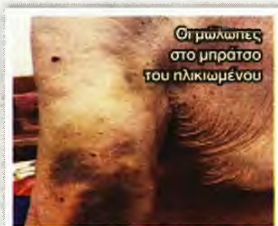
Οι μώλωπες στο μπράτσο του ηλικιωμένου

«Μάτια ρωτούσε γιατί τον δένουν. Δεν του έδιναν κάποια απάντηση, αλλά χρησιμοποιώντας βία προσπαθούσαν να τον δέσουν στα κάγκελα... Αν και είναι 98 ετών, προσπάθησε να ανηδρώσει και έσπρωξε τη μια νοσοκόμα με το δεξί του χέρι, η οποία όμως άρχισε να τον χτυπά στο μπράτσο, προκαλώντας του μώλωπες που είναι ακόμη εμφανείς. Υστερα από αυτό "παραδόθηκε" και τον έδεσαν»