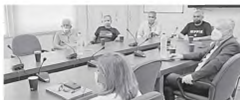
Στιγμιότυπο από τη σύσκεψη των συνδικαλιστών με τη διοίκηση του ΠΓΝΠ