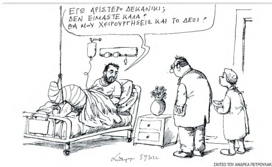
ΣΚΙΤΣΟ ΤΟΥ ΑΝΔΡΕΑ ΠΕΤΡΟΥΛΑΚΗ

Οι πληροφορίες της στήλης λένε πως ο πρώην πρωθυ-