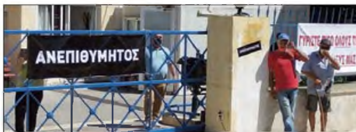
Ξεσηκωμός για το νοσοκομείο Ιεράπετρας

“Οι εργαζόμενοι του Νοσοκομείου Ιεράπετρας εκφράζουν φόβο και απόγνωση για το μέλλον του Νοσοκομείου τους. Μετά τον εξαναγκασμό σε επιπρόσθετες παραιτήσεις των δύο ακτινολόγων και την αδυναμία του ενός που παραμένει για να ανταποκριθεί και που θα εξαναγκαστεί να παραιτηθεί και αυτός, το Ακτινολογικό Τμήμα κλείνει, με τραγικές