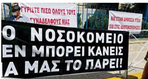
Οι διαμαρτυρόμενοι αγωνισούν για τη λειτουργία των υπηρεσιών και των κλινικών του νοσοκομείου, μετά τον εξαναγκασμό σε παραίτηση γιατρών και διοικητικών υπαλλήλων.