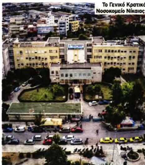
Το Γενικό Κρατικό Νοσοκομείο Νίκαιας.