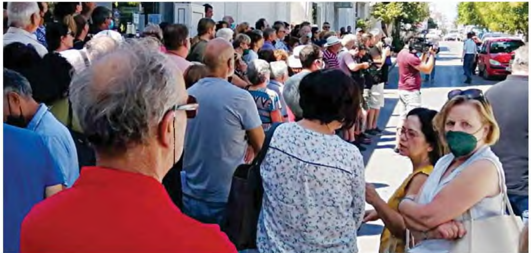
Δυναμική με μεγάλη συμμετοχή ήταν η χθεσινή κινητοποίηση για το Νοσοκομείο της Ιεράπετρας.

■ Ανέβηκαν οι τόνοι στη χθεσινή κινητοποίηση εργαζομένων, φορέων και πολιτών για την υποβάθμιση του νοσοκομείου του Ιδρύματος της Ιεράπετρας