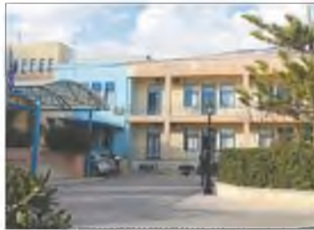
Ξεσηκωμός σήμερα στο νοσοκομείο Ιεράπετρας

Στον δρόμο βγαίνει ο Σύλλογος Φίλων του Νοσοκομείου Ιεράπετρας που οργανώνει συγκέντρωση διαμαρτυρίας σήμερα στις 11 π.μ. στην είσοδο του νοσοκομείου, προειδοποιώντας ότι η υποβάθμιση του νοσοκομείου "δεν θα περάσει".