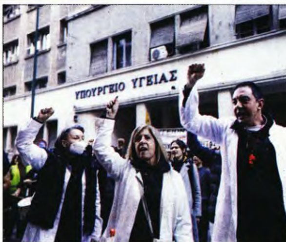
Διαμαρτυρία υγειονομικών. Κάτω: Ο Θάνος Πλεύρης

ΦΡΕΝΟ στις... ορέξεις του θάνου Πλεύρη για διατήρηση του επαίσχυντου μέτρου της αναστολής των συμβάσεων εργασίας για τους ανεμβολίαστους υγειονομικούς και το 2023 φαίνεται πως έβαλε η δημοσιοποίηση του σκεπτικού της απόφασης του Συμβουλίου της Επικρατείας, η οποία δόθηκε προχθές στη δημοσιότητα.