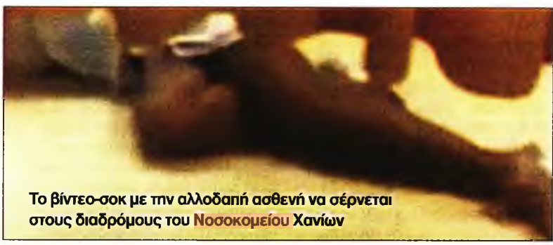
Το βίντεο-σοκ με την αλλοδαπή ασθενή να σέρνεται στους διαδρόμους του Νοσοκομείου Χανίων

«Επικοινωνήσα με την κυρία που κάνει την καταγγελία, της ζήτησα να την κάνει και εγγράφως σε μας, όπως και έγινε. Εχω διατάξει να διεξαχθεί κατεπείγουσα ΕΔΕ για το συμβάν και εκφράζω "συγγνώμη" για το περιστατικό αυτό. Η ασθενής, εξ όσων μου έχει αναφερθεί, ήταν υπό την επήρεια μέθης και σε διέγερση, αλλά και πάλι θα έπρεπε να έχει την κατάλληλη αντιμετώπιση» δήλωσε.