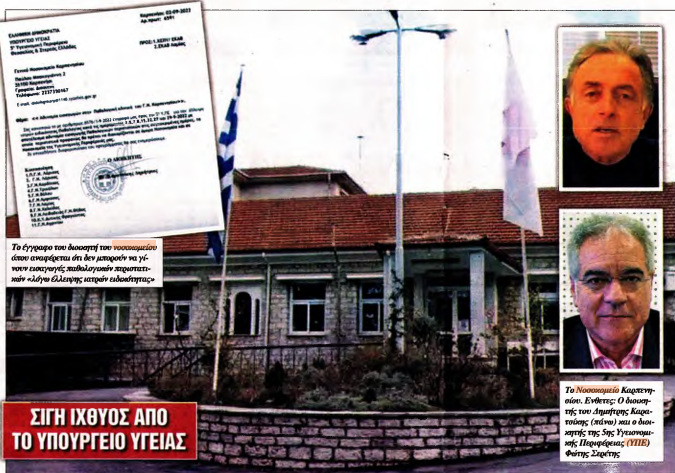
ΣΙΓΗ ΙΧΘΥΟΣ ΑΠΟ ΤΟ ΥΠΟΥΡΓΕΙΟ ΥΓΕΙΑΣ

Κάπως έτσι έχουμε φτάσει στο σημείο αόλακλη Παθολογική Μονάδα να λειτουργεί με μόλις έναν παθολόγο και τον κλινικό ενός παθολόγου που υπή-