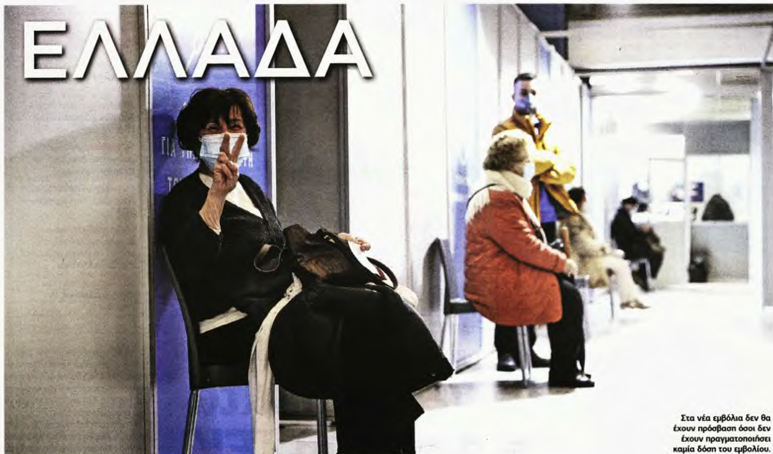
Στα νέα εμβόλια δεν θα έχουν πρόσβαση όσοι δεν έχουν πραγματοποιήσει καμία δόση του εμβολίου.

400.000 ΔΟΣΕΙΣ ΒΡΙΣΚΟΝΤΑΙ ΗΔΗ ΣΤΗΝ ΕΛΛΑΔΑ • ΕΚΤΑΚΤΗ ΕΝΗΜΕΡΩΣΗ ΤΗ ΔΕΥΤΕΡΑ