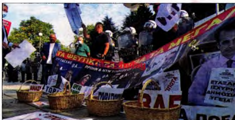
Στιγμιότυπο από περσινή διαμαρτυρία

Η ομοσπονδία καταγγέλλει την κυβέρνηση Μητσοτάκη μιλώντας για συστηματική υποβάθμιση της δημόσιας υγείας και παραθέτει τόσο τα στοιχεία που αφορούν τις οφειλές των νοσοκομείων όσο όμως και το κομμάτι της χρηματοδότησης. Συγκεκριμένα, αναφέρει πως οι δημόσιες δαπάνες Υγείας παραμένουν στο χαμηλότατο ποσοστό, 5%