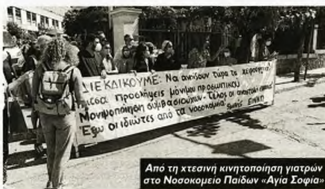
Από τη χτεσινή κινητοποίηση γιαντρώ στο Νοσοκομείο Παιδών «Αγία Σοφία»

«Προσλήψεις μόνιμου προσωπικού τώρα! Μονιμοποιήσεις συμβασιούχων τώρα!» Με διεκδικήσεις όπως αυτές πραγματοποιήσαν χτες κινητοποιήση οι εργαζόμενοι στο Νοσοκομείο Παιδών «Αγία Σοφία », μεταφέροντας δυνατά την «κραυγή αγανάκτησης» για το ξεχαρακωμένο το μεγαλύτερο παιδιατρικό νοσοκομείο της χώρας.