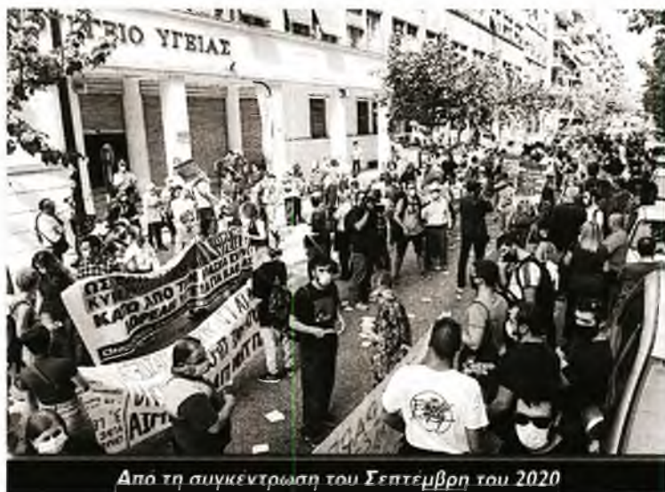
Από τη συγκέντρωση του Σεπτέμβρη του 2020

Την παραπομπή της προέδρου της ΟΕΝΓΕ σε δίκη καταγγέλλει στην εργατική τάξη η Γραμματεία του ΠΑΜΕ, σημειώνοντας: «Εί- ναι ξεκάθαρο ότι η ύπαρξη και κλιμάκωση των κινητοποιήσεων σε κλάδους και χώρους δουλειάς οδηγεί κυβέρνηση και μεγαλοεργο- δοσία να βάλουν σε χρήση ό,τι πιο αντιδραστικό έχουν νομοθετή- σει όλο το περασμένο διάστημα, προκειμένου να σταματήσουν τις αντιδράσεις που πολλαπλασιάζονται. Της προώθησης με ακόμα μεγαλύτερη ένταση της πολιτικής που τοακίζει την εργατική τάξη