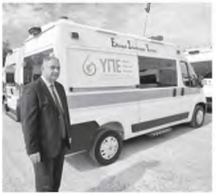
Ο Γ. Καρβέλης επί της παραλαβής

Είκοσι ολοκαίνουργια ασθενοφόρα πλήρους εξοπλισμέ- να παρέλαβε σήμερα η 6η Υγειονομική Περιφέρεια, με- τα από παρέμβαση του διοικητή της 6ης ΥΠΕ Πάνη Καρ- βέλη για επίτευξη των διαδικασιών σε συνεργασία με τις τεχνικές υπηρεσίες και το Τμήμα Προμηθειών της 6ης ΥΠΕ.