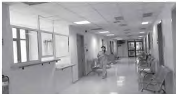
Ο νέος χώρος του εργαστηριακού τομέα του Κ. Υγείας Βορείου Τομέα

προσθετικό για τα μασελάκια υπάρχει λίγη αναμονή τεο- σάρων μινών, ενώ για πλη- ρη οδοντοστοιχία τα ραντεβού έχουν κλείσει μέχρι τέλος του χρόνου. Κι αυτό οφείλεται κυ- ρίως στην έλλειψη που υπάρ- χει σε τεχνίτες. Σε όλη την Πρωτοβάθμια Φρο- ντίδα Υγείας της Αχαΐας, υπάρ- χει μόνον ένας ορθοπαιδικός, ο οποίος έχει συνταξιοδοτηθεί, αλλά παραμένει με παράταση δύο ετών. Πλήγμα για το Κέντρο Υγείας Βορείου Τομέα αποτέλεσε η αναστολή λειτουργίας του Παιδοψυχιατρικού Τμήματος