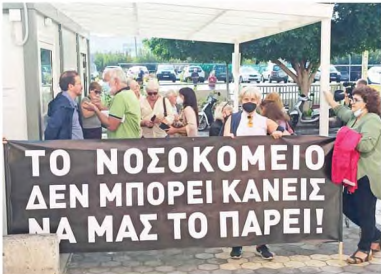
Το "παρών" έδωσαν αυτοδιοικητικοί παράγοντες, πρώην βουλευτές, πολίτες αλλά και ο Σεβασμιότατος Μητροπολίτης Ιεραπότνης και Σητείας κ.κ. Κύριλλος, με σκοπό να γίνει σαφές προς πάσα κατεύθυνση πως η υποβάθμιση του νοσοκομείου είναι ορατή.