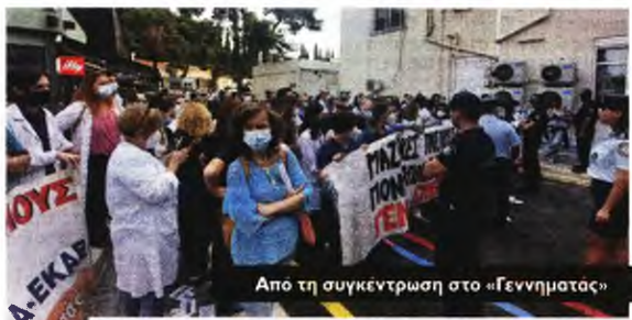
Από τη συγκέντρωση στο «Γεννηματάς»

«Επόμενος σταθμός των αγωνιστικών κινητοποιήσεων είναι η πανελλαδική πανεργατική απεργία στις 9 Νοέμβρη», σημειώνουν οι υγειονομικοί, με στόχο στα νοσοκομεία και στα Κέντρα Υγείας να παραμείνει τη μέρα της απεργίας μόνο το προσωπικό ασφαλείας, διεκδικώντας, μαζί με την ενίσχυση του δημόσιου συστήματος Υγείας, μαζικές προσλήψεις, μονιμοποιήσεις επικουρικών και συμβασιούχων, ένταξη στα ΒΑΕ, αυξήσεις στους μισθούς, επαναφορά των επιδομάτων που έχουν κηλη κ.ο.κ.