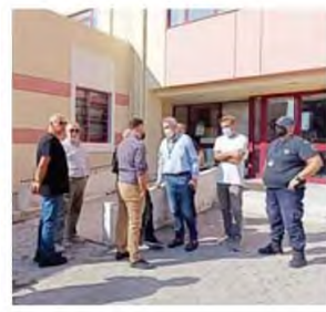
Όπως τόνισαν οι συμμετέχοντες στη σύσκεψη, την επόμενη εβδομάδα αναμένεται να γίνει προσπάθεια να κλειστεί ραντεβού συνάντησης με τον υπουργό Υγείας, ενώ σε ό,τι αφορά το θέμα του υποδιοικητή, δεν υπήρξε κάποια εξέλιξη.