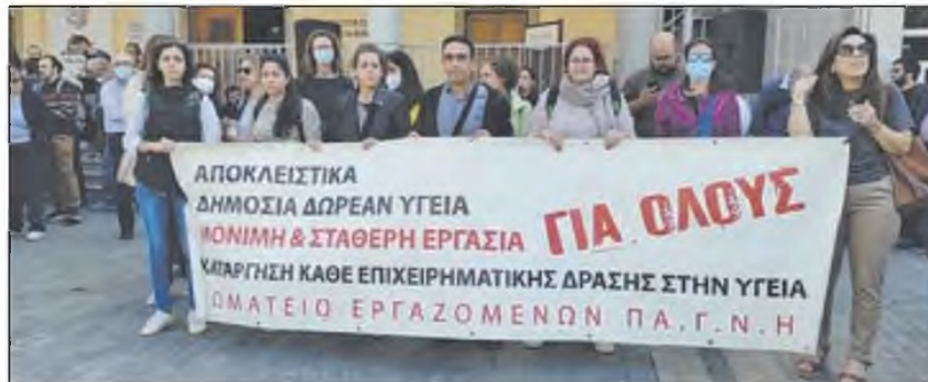
Στιγμιότυπο από τη χθεσινή κινητοποίηση των υγειονομικών στο Ηράκλειο