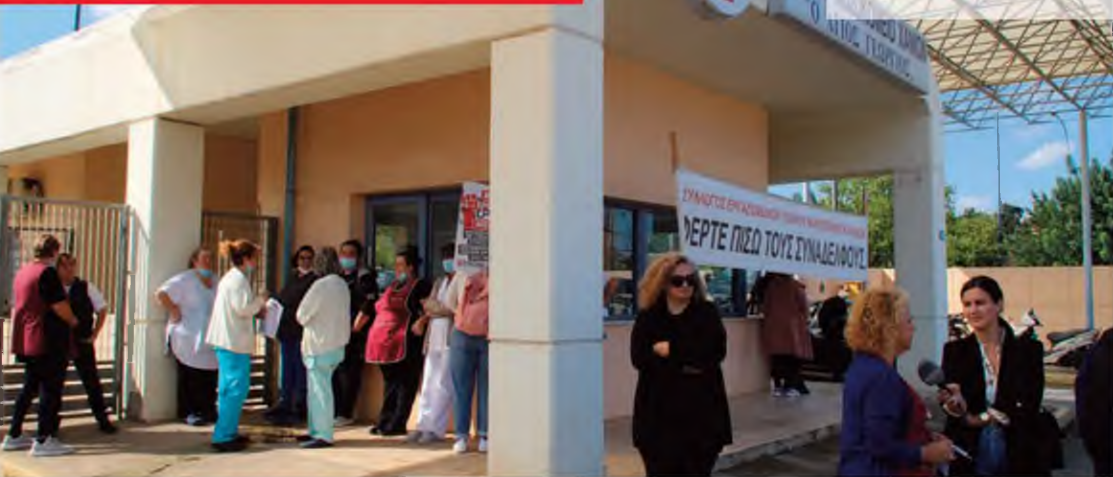
Από τη χθεσινή συγκέντρωση στην πύλη του Νοσοκομείου.

Επίσης, ζητούν «μονιμοποίηση των συμβασιούχων», «ένταξη τους στα βαρέα και ανθυγιεινά» «να βγουν οι εργολάβοι από τα νοσοκομεία», «αύξηση των μισθών». Ακόμα τόνισε ότι «χρησιμοποιούμε προ-