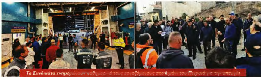
Τα Συνδικάτα ενήμερων κατόρθωσαν να οργανώσουν απεργιακούς σταθμούς στο λιμάνι του Πειραιά για την απεργία

Μ ε απεργιακές αποφάσεις, ναυτεργάτες, λιμενεργάτες της COSCO, μεταλλεργάτες και ναυπηγολογχοί της Ζώνης συντονίζουν την αγωνιστική τους δράση και ετοιμάζονται να «παγώσουν» την Τρίτη 25 Οκτώβρη το λιμάνι του Πειραιά. Η απεργία και οι κινητοποιήσεις που οργανώνουν κλαδικά σωματεία από τους παραπάνω χώρους θέτουν στο επίκεντρο αιτήματα και διεκδικήσεις με ιδιαίτερη σημασία για τους εργαζόμενους, ενώ αποτελούν σημαντικό αγωνιστικό σταθμό στην πορεία προς την πανελλαδική πανεργατική απεργία στις 9 Νοέμβρη.