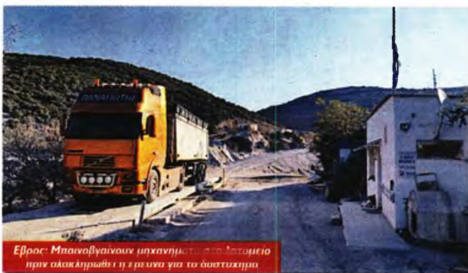
Εβρος: Μπαιοβγαίνουν μηχανήματα στο λατομείο πριν ολοκληρωθεί η εργασία για το δασύχημα

Πιο συγκεκριμένα, ο συνδικαλιστής αναφέρεται σε μεγάλα και γνωστά εργοστάσια του κλάδου, που αυξανόμεν π.χ. την παραγωγή με 16ώρα, κόντρα βάρδιες κ.λπ. Η αλλού, όπου εργάζονται σε τμήματα δεκάδες εργολαβικοί εργαζόμενοι, ενώ σε μια σειρά από χώρους οι υπερωρίες και η δουλειά τις άργες πάνε και έρχονται. «Αυτό επιβαρύνει τον οργανισμό των