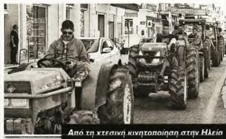
Από τη χρεωστή κινητοποίηση στην Ηλεία

Μ ε οργανωτές τους κατά τόπους Αγροτικούς Συλλόγους και τις Ομοσπονδίες, που συντονίζουν τη δράση τους μέσα από την Πανελλαδική Επιτροπή των Μπλόκων, οι βιοπαλαιστές αγρότες και κτηνοτρόφοι από διάφορες περιοχές της χώρας διαδηλώνουν αύριο στη Θεσσαλονίκη, στην έκθεση «Agrotica».