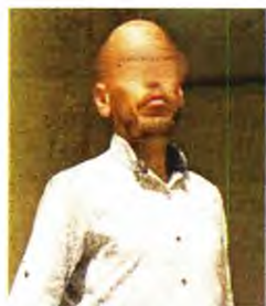
Ο υπάλληλος του «Μεταξά» που εμπλέκεται στην υπόθεση βιασμού