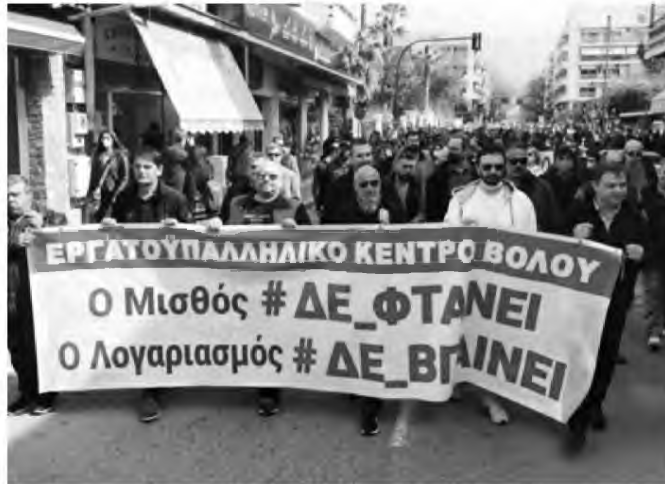
Οι εργαζόμενοι επιδιώκουν να στείλουν ηχηρό μήνυμα ότι δεν θα ανεχτούν άλλα ημίμετρα, απαιτώντας εδώ και τώρα αυξήσεις στους μισθούς

Ο ταν η ΓΣΕΕ και η ΑΔΕΔΥ στα μέσα του περασμένου Οκτωβρίου λάμβαναν την απόφαση για την προκήρυξη πανεργατικής απεργίας στις 9 Νοεμβρίου ενάντια στην ακρίβεια και την εξαθλίωση ο στόχος ήταν ένας: Να σταλεί το μήνυμα στην κυβέρνηση ότι μετά από 12 χρόνια μνημονίων, υγειονομικής και ενεργειακής κρίσης, με την ακρίβεια να «σασκίζει» τους οικογενειακούς προϋπολογισμούς πρέπει να ληφθούν μέτρα στήριξης των μισθωτών.