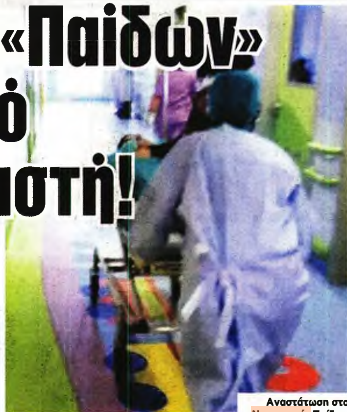
Αναστάτωση στο Νοσοκομείο Παιδών «Αγλαΐα Κυριακού».

Ο υπουργός Υγείας Θάνας Πλεύρης, μετά τις καταγγελίες που είδαν το φως της δημοσιότητας για το νοσοκομείο , έδωσε εντολή να διενεργηθεί άμεσα ΕΔΕ. Το Τμήμα Ανηλίκων ερευνά την καταγγελία και τα παιδιά -ο 7χρονος και η 13χρονη- θα εξεταστούν από ιατροδικαστή, ενώ και τα 37 παιδιά, παρουσία παιδοψυχολόγου, θα δώσουν κατάθεση στις Αρχές ώστε να φανεί αν υπάρχει κι άλλο αντίστοιχο περιστατικό. Σημειώνεται πως ο 14χρονος βρίσκεται στο «Παιδών» από τον περασμένο Ιούλιο, συμπληρώνοντας πέντε μήνες. Κατά πληροφορίες, έχει απομακρυνθεί από το σπίτι του λόγω κακοποίησης από τον πατέρα του. Σύμφωνα μάλιστα με τα όσα είπε ο πρόεδρος της ΠΟ-ΕΔΗΝ, Μιχάλης Γιαννάκος, αυτή τη στιγμή 37 παιδιά φιλοξενούνται εκεί, για τους ίδιους λόγους, χωρίς να έχουν κάποιο πρόβλημα υγείας!