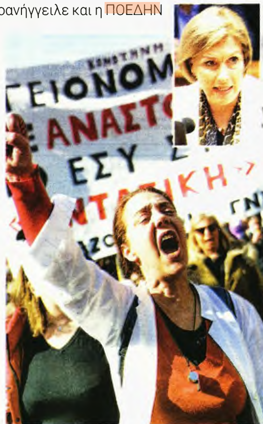
Στιγμιότυπο από παλαιότερη κινητοποίηση των υγειονομικών. Ενθετη: Η αναπληρώτρια υπουργός Υγείας

Γκρίνια και εντός Ν.Δ.! Πολλά καραμανλικά στελέχη διαφωνούν με το ξήλωμα του ΕΣΥ