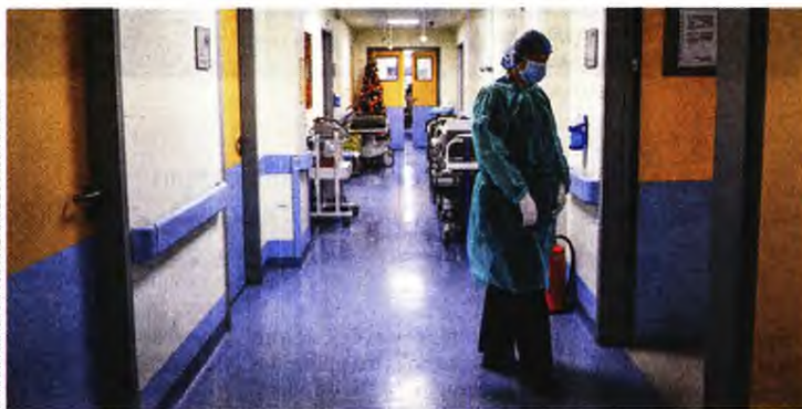
ΤΑΤΙΑΝΑ ΜΠΟΥΛΑΡΗ/ΕΠΙΧΕΙΡΗΣΙΑΚΟΙ ΣΤΟΙΧΕΙΑ

Με ανακοίνωσή της η Ενωση Νοσοκομειακών Ιατρών Πέλλας γνωστοποίησε ότι