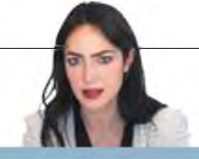
THE ΔΟΜΝΑΣ ΜΙΧΑΗΛΙΔΟΥ

Η επιστολή-έκκληση της ΠΟΕΔΗΝ προς το υπουργείο Δικαιοσύνης για να σταματήσουν οι εισαγωγικές εντολές που στέλνουν παιδιά σε νοσοκομεία επ' άοριστον