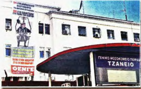
Γιγαντοπανό ενάντια στο νομοσχέδιο είναι αναρτηθεί στα νοσοκομεία της Αττικής τις παραμονές της προαφής απεργίας

Να αποσυρθεί, απαιτούν οι βουλευτές του ΚΚΕ | Την Πέμπτη 1η Δεκεμβρη μπαίνει στην Ολομέλεια