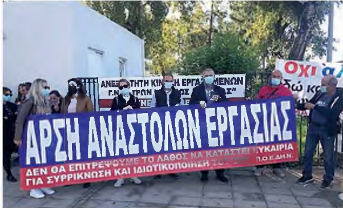
Από παλαιότερη διαμαρτυρία των ανεμβολίαστων υγειονομικών στην πύλη του «Αγίου Ανδρέα»

Ο ΥΠΟΥΡΓΟΣ Ο υπουργός Υγείας Θάνος Πλεύ-