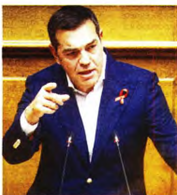
Οι Αλ. Τσίπρας και Μιχ. Κατρίνης χθες στη Βουλή

Ο ίδιος, μάλιστα, ανέλυσε εμβριθώς αυτό το σχέδιο, μιλώντας για μονιμοποίηση όλων των υγειονομικών που έδωσαν τη μάχη της πανδημίας και για 5.000 άμεσες προσλήψεις, με τους βουλευτές της Νέας Δημοκρατίας να σχολιάζουν στα πηγαδάκια πως έδωσε ρεσιτάλ παροχολογίας. Την ίδια ώρα, ο πρόεδρος του ΠΑΣΟΚ Νίκος Ανδρουλάκης, με δήλωσή του, ξεκαθάρισε πως το κόμμα του διαφωνεί με το νομοσχέδιο, καθώς αποδιαιρθώνει πλήρως το