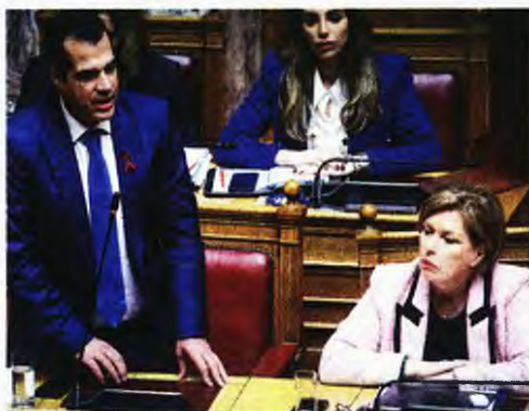
Θάνος Πλεύρης, Μίνα Γκάγκα

σιζεται πλέον στον "καλό γιατρό", αλλά στη συνέντευξη, στις καλές ομάδες γιατρών και νοσηλευτών που συνεργάζονται και δεν αλληλοεξοντώνονται για να κυνηγήσουν τον πελάτη ή το "φακελάκι". Καταλιγώντας επανέλαβε πως μπροστά στον Κυριάκο Μητσοτάκη και στην κυβέρνηση που επιδιώκει να διαλύσει ότι έχει απομείνει όρθιο, η πτέρυγα της αξιωματικής αντιπολίτευσης αντιτάσσει το όραμά της για ένα δίκαιο, ισχυρό και αποτελεσματικό σύστημα Υγείας με επίκεντρο τις ανάγκες των πολιτών.