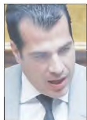
Ο υπουργός Υγείας Θάνος Πλεύρης

Για ένα μεταρρυθμιστικό νομοσχέδιο που πηγάζει τη χώρα στην επόμενη δεκαετία, την ώρα που μέρος της αντιπολίτευσης ζει ακόμα στο 1983, μίλησε ο υπουργός Υγείας Θάνος Πλεύρης, στο πλαίσιο τοποθέτησής του, επί του νομοσχεδίου για τη δευτεροβάθμια περίθαλψη, στην ολομέλεια της Βουλής.