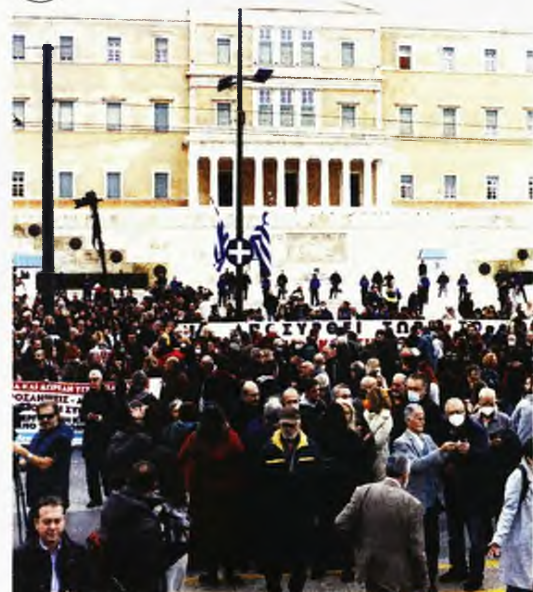
Από τη χθεσινή συγκέντρωση των υγειονομικών στο Σύνταγμα

Σε ένα σύστημα υγείας που ήταν σε έναν άλλον κόσμο, με ασθενείς που είχαν άλλες ανάγκες, άλλη τεχνολογία και άλλες δυνατότητες».