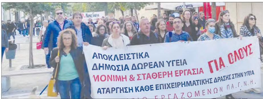
Υγειονομικοί και κοινωνικοί φορείς βγήκαν χθες στους δρόμους για να διαδηλώσουν κατά του νομοσχεδίου

Κατά το νομοσχεδίου έχουν ταχθεί όλες οι Ενώσεις Νοσοκομειακών Ιατρών της χώρας και ο Πανελλήνιος Ιατρικός Σύλλογος, ωστόσο η αναπληρώτρια υπουργός Υγείας κ. Μίνα Γκάγκα, σχολιάζοντας αναφορές της αντιπολίτευσης για την αντίθεση ιατρικών συλλόγων και γιατρών του ΕΣΥ στις επίμαχες διατάξεις, είπε ότι «το νομοσχέδιο που έχει στόχο την ενδυνάμωση του ΕΣΥ, έχει την