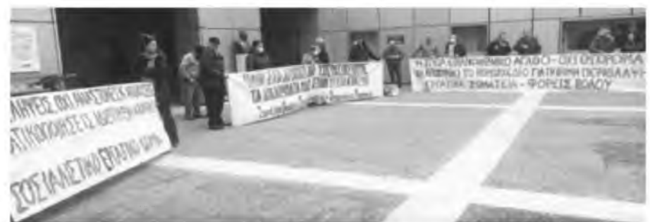
Από τη χθεσινή κινητοποίηση έξω από το Νοσοκομείο Βόλου, με αίτημα την απόσυρση του νομοσχεδίου για τη δευτεροβάθμια βαθμίδα υγείας

Σ ε σύνολο 208 γιατρών του Νοσοκομείου Βόλου, μόλις ένας συμμετείχε χθες επίσημα, σύμφωνα με τα στοιχεία του Αχιλλοπούλειου, στην 24ωρη απεργία της Ομοσπονδίας Νοσοκομειακών Γιατρών Ελλάδας, που πραγματοποιήθηκε σε όλη την Ελλάδα, με αφορμή την κατάθεση του νομοσχεδίου για την υγεία και τις αλλαγές, που επέρχονται.