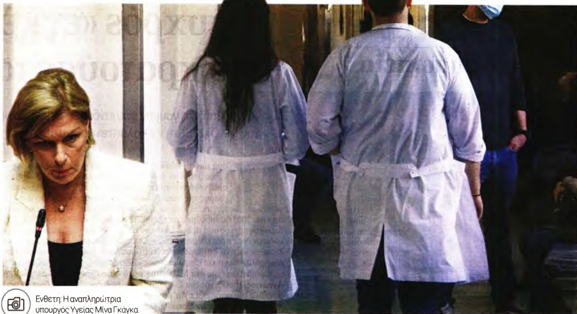
Ενθετή: Η αναπληρώτρια υπουργός Υγείας Μίνα Γκάγκα

Όσο και αν οι μεταγραφές του ακραίου Κέντρου (βλέπε Μίνα Γκάγκα) και της ακραίας Δεξιάς (βλέπε θάνατος Πλεύρης) προσπαθούν να μας πείσουν για το αντίθετο, οι γιατροί του ΕΣΥ δεν αποφάσισαν να γίνουν σε μια νύχτα... κομμουνιστές, δεν εμφορούνται από συντεχνιακά αιτήματα και δεν συμμερίζουν σε κανένα κρυφό κέντρο αποσταθεροποίησης της κυβέρνησης Μπιστοτάκη. Απλά δεν έχουν πάρει διαζύγιο από τη λαϊκότητα,