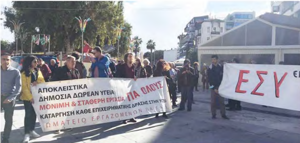
Από τη χθεσινή κινητοποίηση των υγειονομικών του Ηρακλείου.

Με τη συγκέντρωσή τους έξω από τη Βουλή εξέφρασαν την καταδική τους στο νομοσχέδιο χθες οι γιατροί και οι εργαζόμενοι των νοσοκομείων. «Οι νοσοκομειακοί γιατροί γίνονται ένα με τον λαό υπερασπιζόμενοι το δικαίωμα στην Υγεία και τη