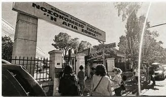
Δομές του Νοσοκομείου Παιδών «Η Αγία Σοφία» ετοιμάζεται να «ενσωματώσει» ιδιωτικό παιδοογκολογικό νοσοκομείο

«Όλα αυτά όμως γίνονται ήδη στα τμήματα αυτά... Οπότε δεν μας λένε τι σημαίνει στην πράξη το ξεπούλημα ενός κομματιού δημόσιου νοσοκομείου, και συγκεκριμένα που αφορά ογκολογικούς ασθενείς σε ιδιωτικό κέντρο κάτω από την εποπτεία της εφοπλιστού Βαρδινογιάννη», σημειώνει η