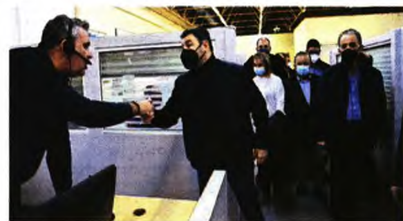
Ευχές με τους εργαζομένους στο ΕΚΑΒ αντάλλαξε ο Νίκος Ανδρουλάκης.

του ΕΚΑΒ και να ακούσουμε τα προβλήματα που αντιμετωπίζουν καθημερινά». Ο κ. Ανδρουλάκης πρόσθεσε ότι «είναι χρέος η ενίσχυση του Εθνικού Συστήματος Υγείας μετά τη δοκιμασία της πανδημίας, αλλά και εν μέσω της οικονομικής κρίσης, που αυξάνει το κόστος ζωής». Τόνισε ότι «είναι αδιανόητο ο ελληνικός λαός να πληρώνει τις τρίτες υψηλότερες ιδιωτικές δαπάνες για την υγεία του στην Ευρωπαϊκή Ένωση. Γι' αυτό οφείλουμε να κάνουμε ό,τι περνά από το χέρι μας για να έχουμε ξανά ένα ισχυρό Εθνικό Σύστημα Υγείας, θεματοφύλακα της μείωσης των μεγάλων κοινωνικών ανισοτήτων της εποχής μας».