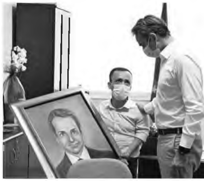
«Γλείψε, γλείψε και μείνε...». Μπιστοτάκωθηκε στη θέση του σαν η «Μαντάμ Τισό» του Κούλη.