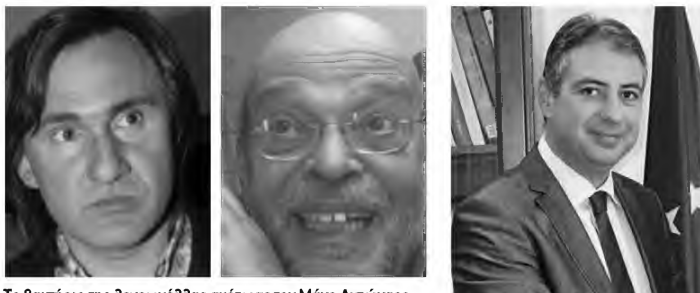
Το βακτήριο της λεγεωνέλλας σκότωσε τον Μάνο Αντώνη και έληξε τον ηθοποιό Άκη Σακελλάρη. Η μετάδοση επιτυγχάνεται όταν το άτομο εισπνεύσει ή πίνει σταγονίδια μολυσμένου νερού με λεγεωνέλλα.

Ενδεικτικό του πανικού τους, πάντως, είναι ότι η διοίκηση του νοσοκομείου αναφέρει με λεπτομέρειες για το πώς αντιμετωπίζεται το θέμα από την Δν ΥΠΕ του «ηγεμόνα» των αναθέσεων Καρβέλη. «Μετά τη γνωστοποίηση των αποτελεσμάτων της δειγματοληψίας άμεσα η διοίκηση του Νοσοκομείου σε συνεργασία με τον διοικητή της Δνς ΥΠΕ, κ. Καρβέλη, τον καθηγητή Υγιεινής του τμήματος Ιατρικής του Πανεπιστημίου Πατρών, κ. Βανταράκη, την Επιτροπή Νοσοκομειακών Λοιμώξεων του Νοσοκομείου, τον υγιεινολόγο κ. Λευτάκη, προϊστάμενο Δ/νσης Νοσηλευτικής Υπηρεσίας, τον χημικό μηχανικό εξειδικευμένο στην επεξεργασία ύδατος νοσηλευτικών μονάδων της ιδιωτικής εταιρείας OSMO, τους τεχνι-