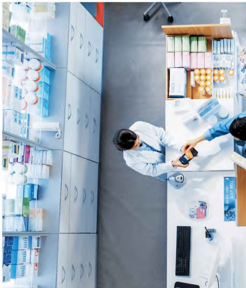
Μια πρόσφατη αλλαγή συμβουλών στην Αγγλία επέτρεψε τη χρήση αντιβιοτικών σε παιδιά που διατρέχουν κίνδυνο στρεπτοκοκκού Α.

Για να γίνει αντιληπτή η κατάσταση, να αναφέρουμε ότι η Sandoz, η επιχείρηση γενόσημων προϊόντων NVS 1.64% της ελβετικής φαρμακοβιομηχανίας Novartis AG, δήλωσε ότι αντιμετωπίζει καθυστερήσεις στην πλήρωση των παραγγελιών επειδή δεν μπορεί να προμηθευτεί όλα τα βιτωτά καπάκια και άλλα εξαρτήματα που χρειάζεται. Η Centrient Pharmaceuticals Netherlands BV, ένας άλλος μεγάλος παραγωγός αντιβιοτικών, δήλωσε ότι μειώσε την παραγωγή ενός βασικού συστατικού επειδή δεν μπορεί να αυτήσει τις τιμές αρκετά ώστε να αντισταθμίσει το αυξανόμενο κόστος ηλεκτρικής ενέργειας.