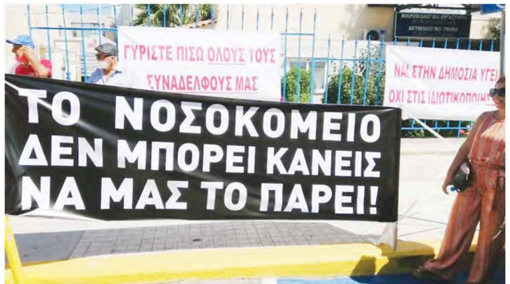
Το Νοσοκομείο Ιεράπετρας μένει με ένα μόνο καρδιολόγο, αφού ο ένας εκ των δύο που υπηρετούσαν ζήτησε και τοποθετήθηκε μόλιμα πλέον στο Νοσοκομείο Αγίου Νικολάου.

■ Μένει με ένα καρδιολόγο το Νοσοκομείο της Ιεράπετρας, ενώ δρομολογείται η αποχώρηση τεσσάρων ακόμη γιατρών τους επόμενους μήνες - Προειδοποιεί με νέες κινητοποιήσεις ο Σύλλογος Φίλων του Νοσοκομείου