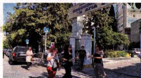
Από πρόσφατη εξόρμηση της Ομοσπονδίας Γονέων στο Νοσοκομείο Παιδών «Αγία Σοφία»

Μεγάλη προσέλευση στις εφημερίες σε όλα σχεδόν τα νοσοκομεία, πόλυση αναμονή και ταλαιπωρία, ειδικά για τους μικρούς ασθενείς και τις οικογένειές τους σε παιδιατρικά νοσοκομεία και κλινικές, συνθήκες εξάντλησης για το υγειονομικό προσωπικό. Η έξαρση των αναπνευστικών ιώσεων την περίοδο που διανύουμε βρίσκεται το δημόσιο σύστημα Υγείας σε τραγική κατάσταση, ενώ ταυτόχρονα αποκαλύπτεται την εγκληματική γύμνια ειδικά στα παιδιατρικά νοσοκομεία.