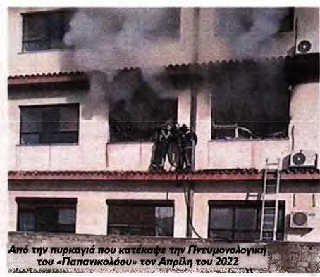
Από την πυρκαγιά που κατέκαψε την Πνευμονολογική του «Παπανικολάου» τον Απρίλη του 2022

Τη δραματική κατάσταση στα νοσοκομεία της Θεσσαλονίκης αναδεικνύει η Τομεακή Επιτροπή Υγείας - Πρόνοιας Κεντρικής Μακεδονίας του ΚΚΕ σε ανακοίνωση που εξετάζει σχετικά με τις εξαγγελίες της κυβέρνησης για ανεγέρσεις νέων νοσοκομείων και ανακαινίσεις κλινικών στη Θεσσαλονίκη.