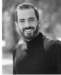
Του Θοδωρή Δουλουμπέκη

Αυτό εξάλλου αποδεικνύουν τα (μη) έργα της και τα νομοθετήματά της. Στο πλαίσιο του στρατηγικού σχεδίου της για την Υγειονομική Περιφέρεια του Ρεθύμνου, εδώ και μερικά χρόνια δεν εκτελούνται ουσιαστικά τακτικά χειρουργεία στο ΓΝΡ, δεν στελεκώνονται οι κλινικές του Νοσοκομείου μας με ιατρικό και νοσηλευτικό προσωπικό, αφού με τους όρους που βάζει η κυβέρνηση και τα δεδομένα της εποχής οι προκλήσεις κηρύσσονται προδιαγεγραμμένα άγονες, ενώ ταυτόχρονα επιχειρείται η σω-