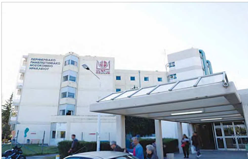
Αναβρασμός στο ΠΑΓΝΗ για τυχόν ανανέωση της θητείας της διοίκησης του νοσοκομείου.

Στη συνέχεια οι εργαζόμενοι τονίζουν πως όχι αλλά θα μείνουν αμέτοχοι, αλλά θα εντατικοποιή-