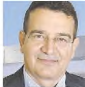
Ο κ. Γ. Κοχιαδάκης

Πρωτοφανείς διαστάσεις έχει πάρει το εκρηκτικό κλίμα μεταξύ του διοικητή του ΠΑΓΝΗ καθηγητή Γιώργου Χαλκιαδάκη, με τους υγειονομικούς του νοσοκομείου, του Ιατρικού Συλλόγου Ηρακλείου αλλά και του Πανελληνίου, ακόμη και της ακαδημαϊκής κοινότητας, μέσω της Ιατρικής Σχολής του Πανεπιστημίου Κρήτης. Με αποφάσεις έκτακτων συνελεύσεων «κατακραυμώνουν» τον διοικητή, ενώ οι εργαζόμενοι του Πανεπιστημιακού Νοσοκομείου προανήγγειλαν κυλιόμενες 24ωρες απεργίες από την ερχόμενη εβδομάδα στα χειρουργεία και «κύμα» παραιτήσεων γιατρών, αν ο υπουργός Υγείας προχωρήσει στην ανανέωση της θητείας του. «Σε ένα δημοκρατικό πανεπιστήμιο δεν γίνεται ο διοικητής να αποκαλεί τους γιατρούς τεμπέληδες και ψεύτες» τονίζεται στα επίσημα πρακτικά της συνέλευσης των μελών ΔΕΠ της Ιατρικής Σχολής. Σελίδα 7