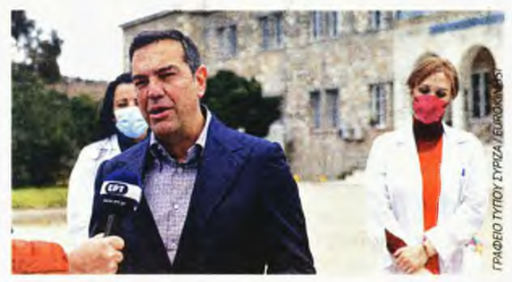
Ο Αλέξης Τσίπρας κατηγορήσε τον πρωθυπουργό ότι «έκανε την επιλογή ενίσχυσης ιδιωτικών νοσηλευτηρίων και πρόσφατα έφερε ένα νομοσχέδιο ιδιωτικοποίησης του ΕΣΥ»

που 50 ενεργές κλίνες. Αρα πάντα θα έχουμε το 30%». «Η κατάσταση είναι τραγική» συμπλήρωσε μια νοσηλεύτρια, σχολιάζοντας ότι «είναι για γέλια να μας χτυπάνε παλαμάκια, ενώ κανένας δεν σκέφτεται το προσωπικό που δουλεύει επί πολλές ημέρες πρωί με βράδυ, συνολικά 16 ώρες». «Είμαι μόνη μου με 40 παιδιά» ανέφερε περιγράφοντας την κατάσταση. Από την πλευρά του ο Αλέξης Τσίπρας έκανε λόγο για συνειδητή υποβάθμιση του ΕΣΥ από την κυβέρνηση Μητσοτάκη και κατηγορήσε τον πρωθυπουργό ότι «αρκέστηκε σε χειροκροτήματα και παράλληλα έκανε την επιλογή ενίσχυσης ιδιωτικών νοσηλευτηρίων και πρόσφατα έφερε ένα νομοσχέδιο που ιδιωτικοποιεί το ΕΣΥ». Αναφέρθηκε ακόμη «στο τεράστιο πρόβλημα» με τις ελλείψεις γιατρών