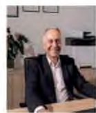
■ Του ΣΤΑΥΡΟΥ ΒΟΥΡΒΑΧΑΚΗ*

Τ ο Γενικό Νοσοκομείο Ρεθύμνου είναι το μοναδικό νοσηλευτικό ίδρυμα που εξυπηρετεί τους 80 χιλιάδες κατοίκους του Νομού μας. Εφημερεύει κάθε μέρα και λόγω του τουρισμού και του Καρναβαλιού τον μισό χρόνο επιβαρύνεται σημαντικά και η δουλειά διπλασιάζεται. Το Νοσοκομείο Ρεθύμνου λειτουργεί με σοβαρές ελλείψεις, με ότι αυτό συνεπάγεται στην παροχή υπηρεσιών υγείας, αλλά και στις συνθήκες εργασίας του προσωπικού. Βασικές κλινικές του και τμήματα υποβαθμίζονται και απειλούνται με οριστικό κλείσιμο. Τόσο στο Ρέθυμνο, όσο και στην υπόλοιπη χώρα, γιατροί του ΕΣΥ παραιτούνται λόγω των εξοντωτικών συνθηκών εργασίας, χωρίς να υπάρχει και καμία προοπτική βελ-