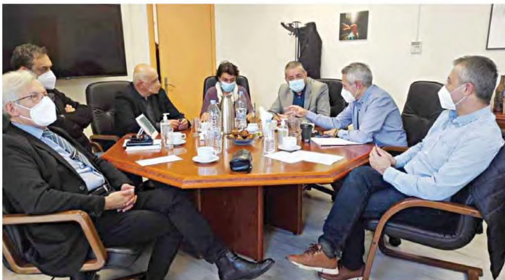
Η εκχώρηση αρμοδιοτήτων προς την Ιατρική Υπηρεσία του νοσοκομείου δείχνει ουσιαστικά ότι επικεφαλής ένας "ευνουχισμός" αρμοδιοτήτων του διοικητή.

Αξίζει να σημειωθεί ότι ο γιατρός Εργασίας που έκανε την έφοδο, σύμφωνα με πληροφορίες του neskriti.gr, έχει υποστηρίξει ακόμη και ενώπιον του Ιατρικού Συλλόγου Ηρακλείου ότι τους έστειλε η Διοίκηση στα σπίτια των αναισθησιολόγων με ρητή εντολή να κάνουν rapid test σε εκείνους που είχαν δηλώσει θετικοί στον κορωνοϊό, φέροντας μαζί τους ακόμη και το αντιδραστήριο του τεστ που τους δόθηκε από το νοσοκομείο. Μάλιστα, οι ίδιες πηγές αναφέρουν ότι ο γιατρός Εργασίας και η επισκέπτρια Υγείας που έκαναν τις εφόδους μεταφέρθηκαν με υπηρεσιακό όχημα, γεγονός που δείχνει ότι υπήρχε σαφής οδηγία από τη Διοίκηση!