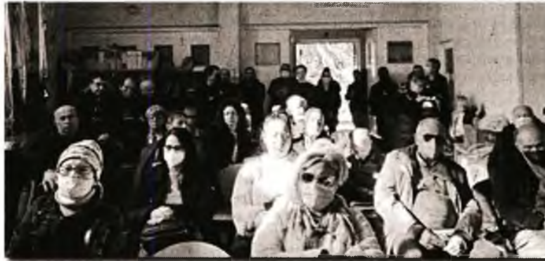
Από τη σύσκεψη που οργάνωσε το Εργατικό Κέντρο

Την οργάνωση απεργιακής κινητοποίησης στην περιοχή και την «κάθοδο» στην Αθήνα, με συλλαλητήριο στο υπουργείο Υγείας, μέσα στον Φλεβάρη, αποφάσισε το Εργατικό Κέντρο Λαυρίου - Ανατολικής Αττικής στη σύσκεψη που πραγματοποίησε την περασμένη Κυριακή, με θέμα την Πρωτοβάθμια Φροντίδα Υγείας στη Λαυρεωτική. Η σύσκεψη έγινε στον απόηχο των αγωνιστικών κινητοποιήσεων για το πρόβλημα που εδώ και χρόνια αντιμετωπίζει ο λαός της περιοχής, όσον αφορά τις δομές Πρωτοβάθμιας Φροντίδας Υγείας, πρόβλημα που το τελευταίο διάστημα πήρε εκρηκτικές διαστάσεις, όταν το Κέντρο Υγείας Λαυρίου έφτασε στο σημείο να σταματήσει προσωρινά την 24ωρη λειτουργία του. Στη σύσκεψη πήραν μέρος εργαζόμενοι και φορείς, τονίζοντας με τις παρεμβάσεις τους την ανάγκη να ενισχυθεί η Πρωτοβάθμια Φροντίδα Υγείας, να γίνουν προσλήψεις μόνιμου ιατρικού προσωπικού στο Κέντρο Υγείας, αλλά και να δημιουργηθεί δημόσιο Γενικό Νοσοκομείο στην Ανατολική Αττική. Στην κατεύθυνση αυτή, στη σύσκεψη αποφασίστηκε πρόγραμμα πολύμορφης δράσης, με ε-